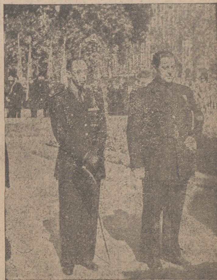
El Gobernador Civil y Jefe Provincial del Movimiento, con el Presidente de la Diputación y Subjefe Provincial, ante el monumento a Colón.

Nuestras primeras autoridades presidieron el acto de afirmación hispánica