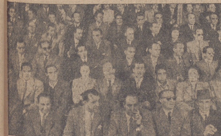
Los "chinchas" locales están satisfechos por el gran juego del primer tiempo y también por el resultado final. (INFORMACION EN ULTIMA PAGINA)