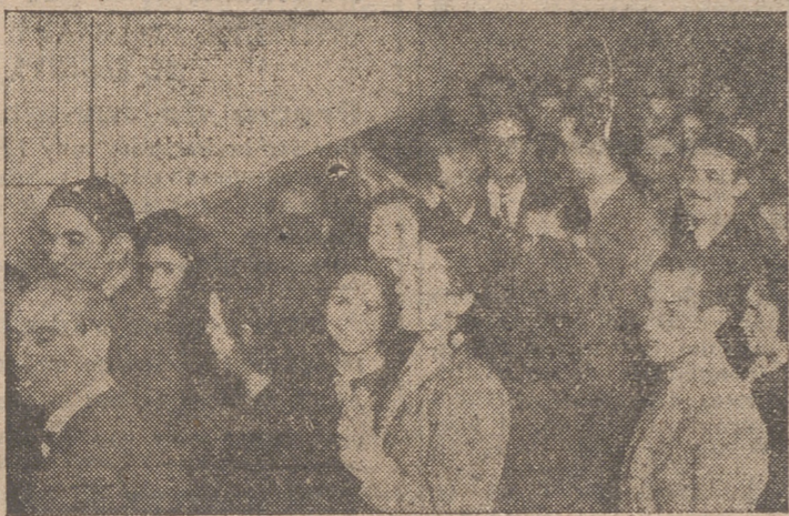
La jornada electoral del domingo constituyó en Valladolid una nota destacadísima por el entusiasmo y la asistencia total de los productores. He aquí dos aspectos de la votación.

A las siete horas de la mañana se constituyeron las cuarenta y cuatro Mesas de las secciones que formaban los veintidós Colegios en que estaba dividida la totalidad del censo.