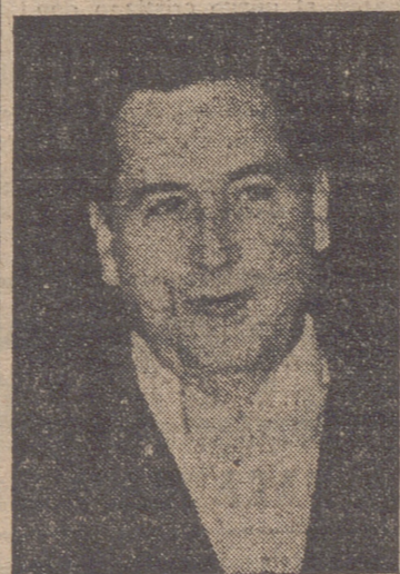
Buenos Aires, 13.—He aquí el discurso pronunciado por el presidente de la Argentina, general Perón, con motivo del día de la Raza y aniversario de Miguel de Cervantes Saavedra: "No me consideraría con derecho a levantar mi voz en el solemne día en que se festeja la gloria de España si mis palabras tuvieran que ser tan sólo halago de circunstancias o sin el ropaje que vistiera una convicción ocasional. Me veo impulsado a expresar mi sentimiento porque tengo la firme convicción de que las corrientes de egoísmo y las encrucijadas de odio que parecen disputarse la hegemonía del orbe serán sobrepasadas por el triunfo del espíritu que ha sido capaz de dar vida civil e idoneidad al Nuevo Mundo. No me atrevería a hacer llegar mi voz a los pueblos que junto con el nuestro formamos la comunidad hispánica para realizar tan sólo una conmemoración protocolar del día de la Raza.

El embajador de España, don Nicolás Franco, conversó animadamente con los representantes diplomáticos americanos durante la fiesta, que transcurrió en medio de la mayor cordialidad y brillantez.—Efe.