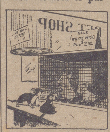
—No he visto cosa semejante. ¿No serán unos fantasma?

fuercas vivas de la ciudad, en espera de cumplimentar a S. E. el Jefe del Estado.—Cifra.