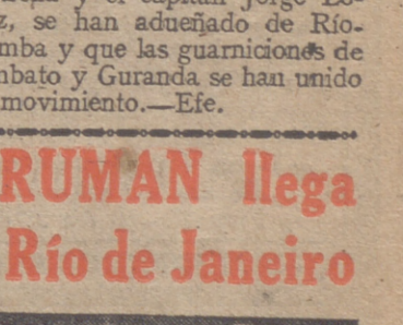
(INFORMACION EN LA PAGINA SEXTA.)