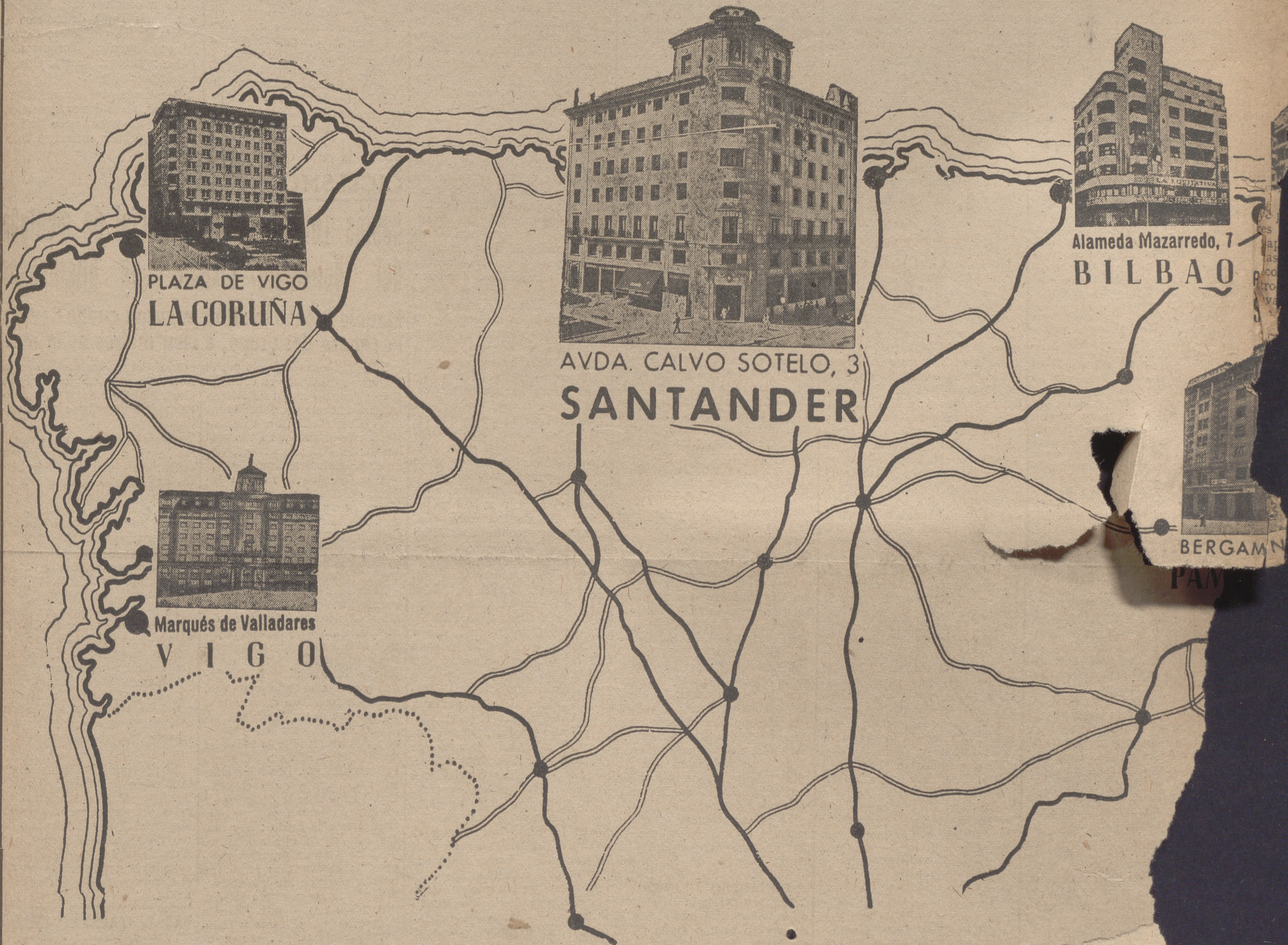
MAPA CON LOS EDIFICIOS SITUADOS EN EL NORTE DE ESPAÑA

Continuando la cadena de edificios que ha construido y viene construyendo