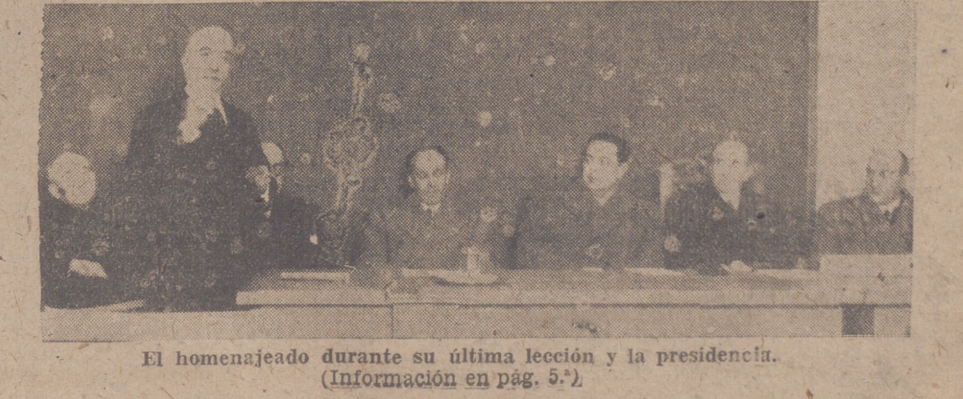
El homenajeado durante su última lección y la presidencia. (Información en pág. 5.ª)