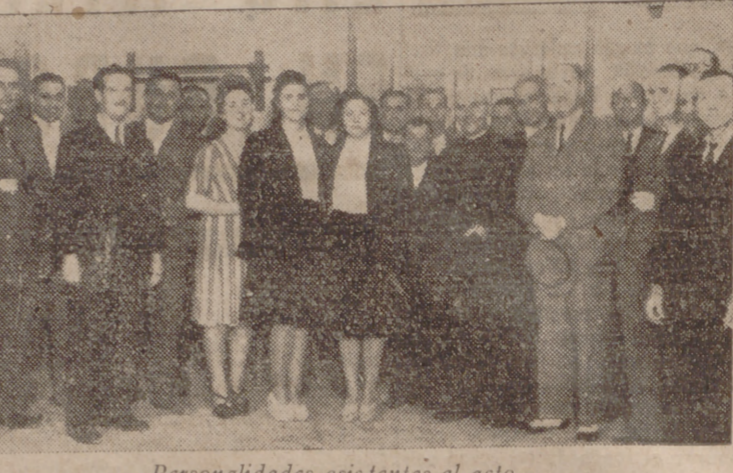
Personalidades asistentes al acto.