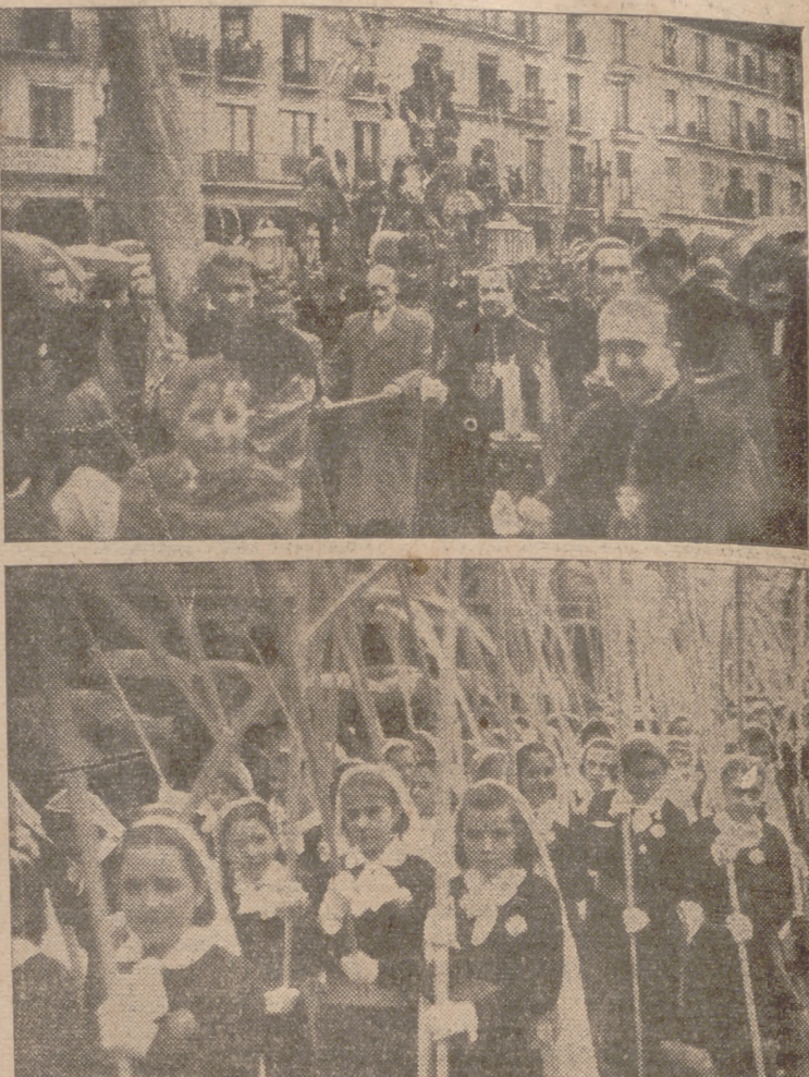
Dos aspectos de la popular y tradicional procesion de la Batriquilla, celebrada el pasado domingo.