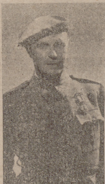
El heroico teniente general Solchaga, iniciador y alma de las formidables instalaciones de la Real Sociedad Hípica.

Nuestra ciudad, cuna de la cabaña española, tiene una brillante historia hípica, porque a lo largo de cerca de medio siglo ha sabido mantener, por obra de la Real Sociedad, esa tradición deportiva que puede competir con la más gloriosa de España. Esta tradición no se ha corrido sobre los laureles de tantos días de gloria, sino que a tenor con el resurgimiento de todas las actividades nacionales, el hípico vallisoletano ha adquirido un auge tan esplendoroso que nos hace augurar un primer puesto de organización, de medios y de categoría dentro del concierto nacional.