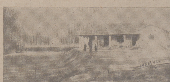
Detalle parcial de las obras del chalet y tribuna de las pistas de la Hípica.