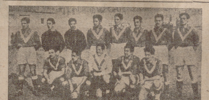
El equipo de balón a mano de Madrid, que en un interesante partido venció por cuatro tantos a dos a la sección guipuzcoana en balón a mano.

(Viene de cuarta página) ... mezo hasta el fin. Esta selección madrileña ha logrado ganar a uno de los mejores equipos de España en este deporte, y es el mismo conjunto que se trasladó a Lisboa. Las experiencias adquiridas en aquel encuentro han sido bien recordadas, cuya demostración la han sabido dar en el encuentro celebrado en la Ferroviaria.