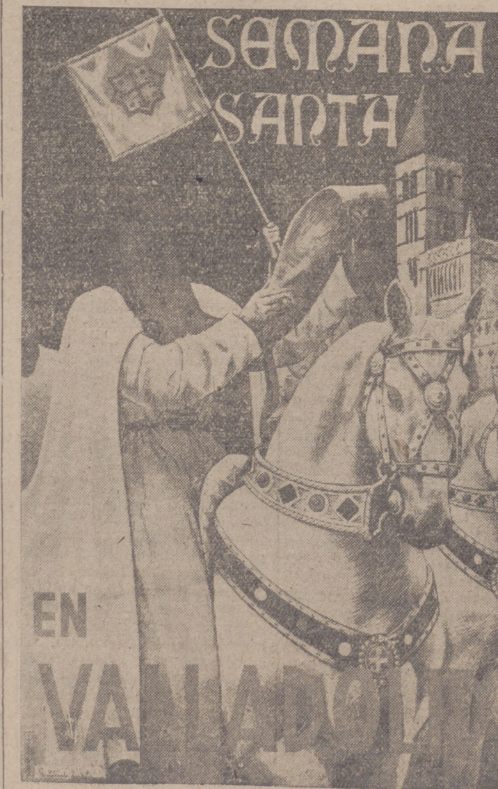
Cartel anunciador de nuestra Semana Santa —primer premio del concurso—, original del catedrático del Instituto señor Ramos, profesor de Dibujo.

imprescindible que el Alto Mando soviético las desarrollara, y en este convencimiento y en el de que los llevarían tiempo se fundaba este observador días pasados para afirmar que la batalla de Berlín tendría que demorarse unos días. Antes de iniciarla es necesario que se adelanten mucho hacia el Oeste los dos flancos retrasados del Ejército bolchevique que se encuentran en Koenigsberg, a quinientos cincuenta kilómetros de Berlín, y en Rautbor, a cuatrocientos cincuenta.