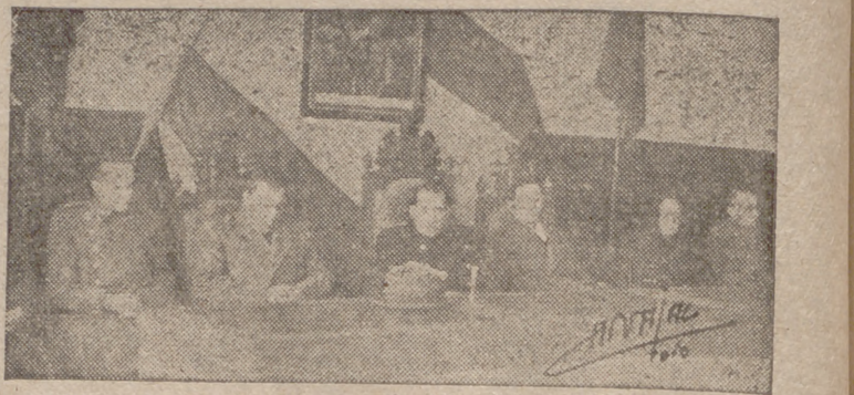
PRESIDENCIA DEL ACTO