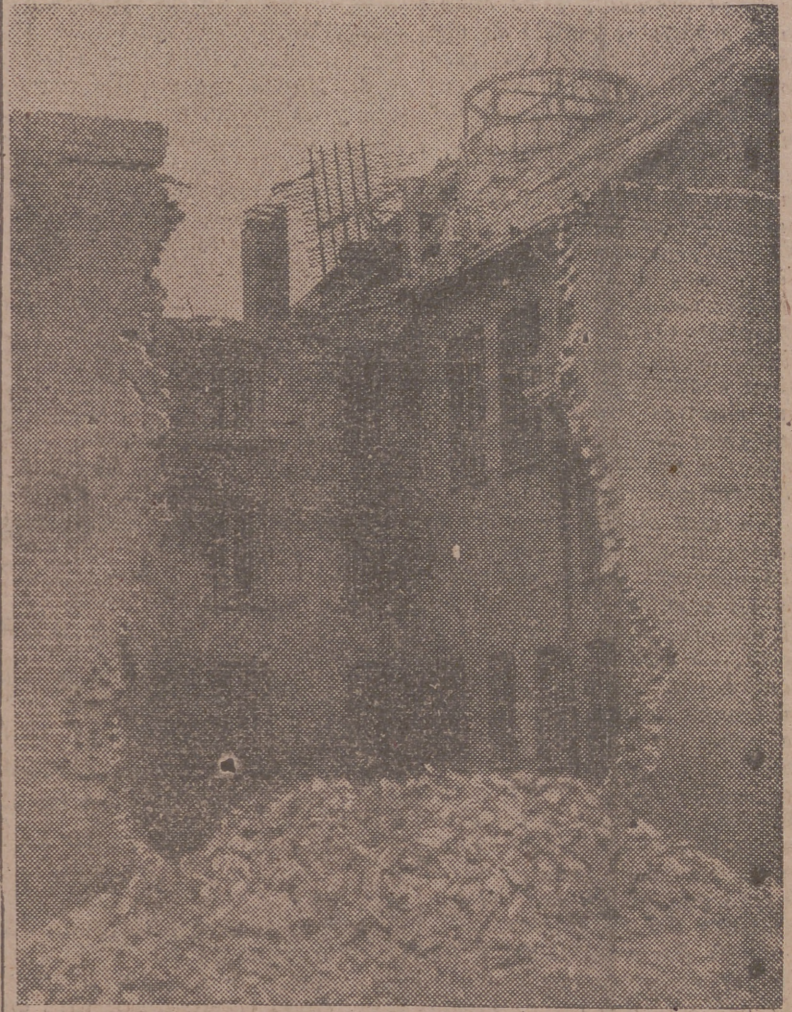
Durante un ataque aéreo británico contra la prisión de Amiens, este muro de la prisión fué destruido, dando ocasión de escapar a más de cien detenidos franceses.