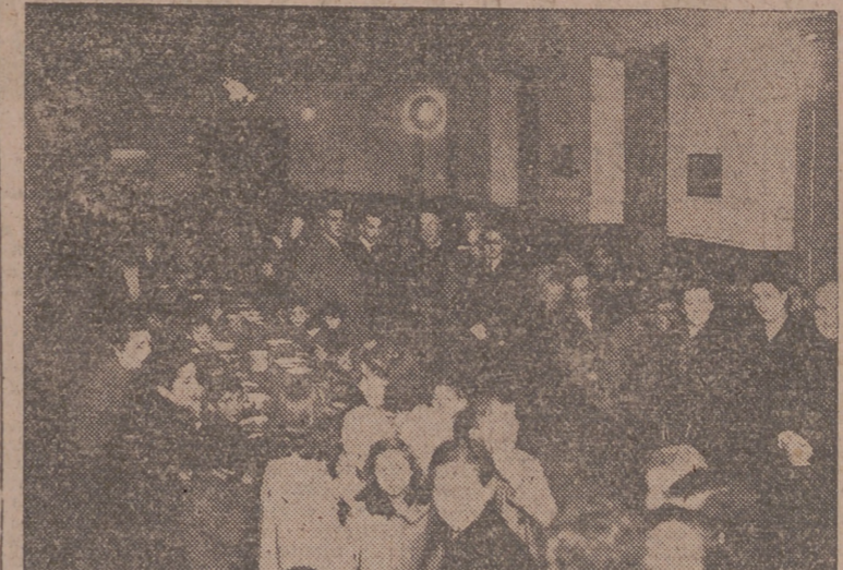
Aspecto del comedor del Asilo de Caridad en la cena extraordinaria de Nochebuena, al reparto de la cual asistieron nuestras primeras autoridades.—(Foto Carbajal).

El excelentísimo y reverendísimo señor Arzobispo, el jefe provincial y gobernador civil, presidente accidental de la Diputación y alcalde de la ciudad asistieron al reparto de las mismas