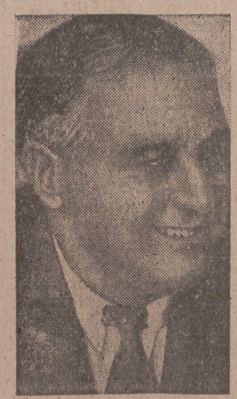
Washington, 25.— En su mensaje radiofónico de Navidad al pueblo norteamericano, el presidente Roosevelt

declaró que no podía decir cuándo los aliados lograrán la victoria definitiva, pero expresó su esperanza de que en las próximas Navidades reine ya la paz en el mundo. «Todos conocemos —dijo— cuán ansiosos están de regresar a sus hogares los miembros de nuestras fuerzas armadas, y ellos conocen también cuánto deseamos nosotros tenerlos aquí, para lo cual el pueblo norteamericano redoblará este año sus esfuerzos en busca del triunfo.» Roosevelt terminó afirmando que la actual generación ha sufrido mucho y que es merecedora de un mañana mejor, sin odios ni angustias, una vez que Europa y Asia hayan sido limpiadas de las influencias nacional-socialistas y fascistas y del imperianismo japonés.—Efe.