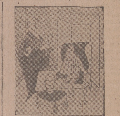
—Con permiso del señor marqués, yo le aconsejaría que no volviese a admitir a su servicio a una secretaria particular cuyo novio fuese campeón de boqueo.