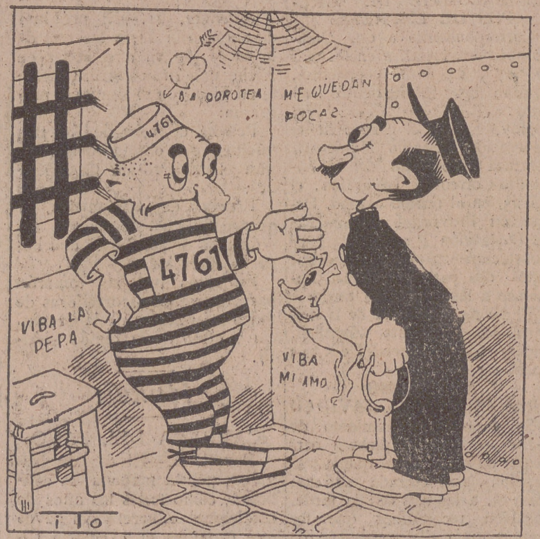
EL 4.761, por ITO. —Ya ve usted; aquí llevo veinte años sin salir. —Pues no pierda las esperanzas, que hoy a lo mejor sale.

Usted asegura que sabe de fútbol como el que más. ¿Por qué no lo demuestra en las quinielas?