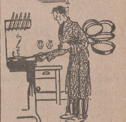
El campeón de tenis cocina un huevo frito.