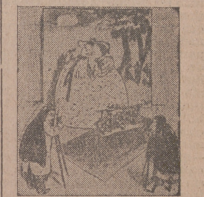
—Usted fotografía el lado derecho y yo el izquierdo. (Das Illustrierte Blatt)