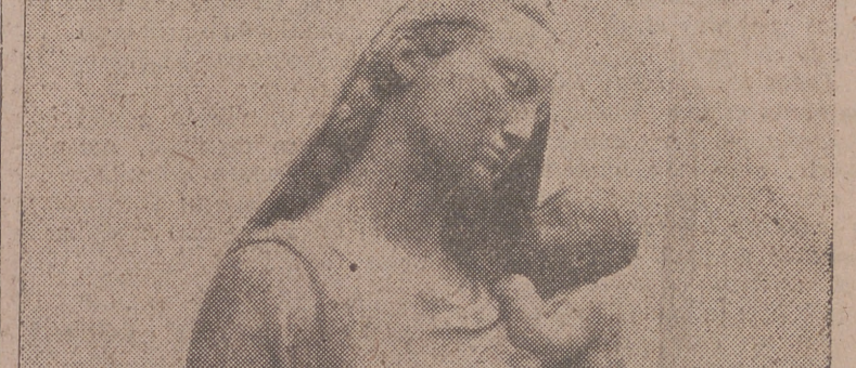
Magnífica talla del escultor José Clará, destinada a la capilla de la Escuela de Mandos del Castillo de la Mota, donada para este fin a la Sección Femenina por nuestro jefe provincial y gobernador civil, camarada Tomás Romojaro.

No se conocen aún suficientes detalles del desarrollo de la ofensiva alemana en el Oeste. Sabemos, eso sí, que la operación sigue en pleno desenvolvimiento, mientras que en consecuencia en Italia los anglo-americanos han desencadenado un fortísimo ataque, muy intensamente preparado por la artillería, mientras que en el Este los rusos, a su vez, han incrementado su presión, sobre todo entre el Balatón y el Danubio. Es natural; se trata de prevenir la posibilidad de que el Mando Supremo germano quiera sacar tropas de estos frentes para reforzar la ofensiva occidental.