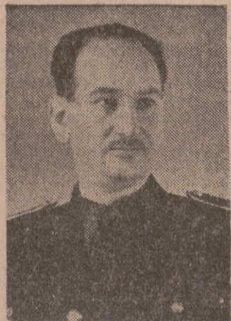
Madrid, 19.—Por enfermedad del ministro secretario general del Movimiento se ha suspendido la conferencia que el camara-

“Vamos a hacerlo de una manera seria, española y cristiana. No a través de las apasionadas fluctuaciones políticas, sino de las funciones familiares, sindicales y municipales”