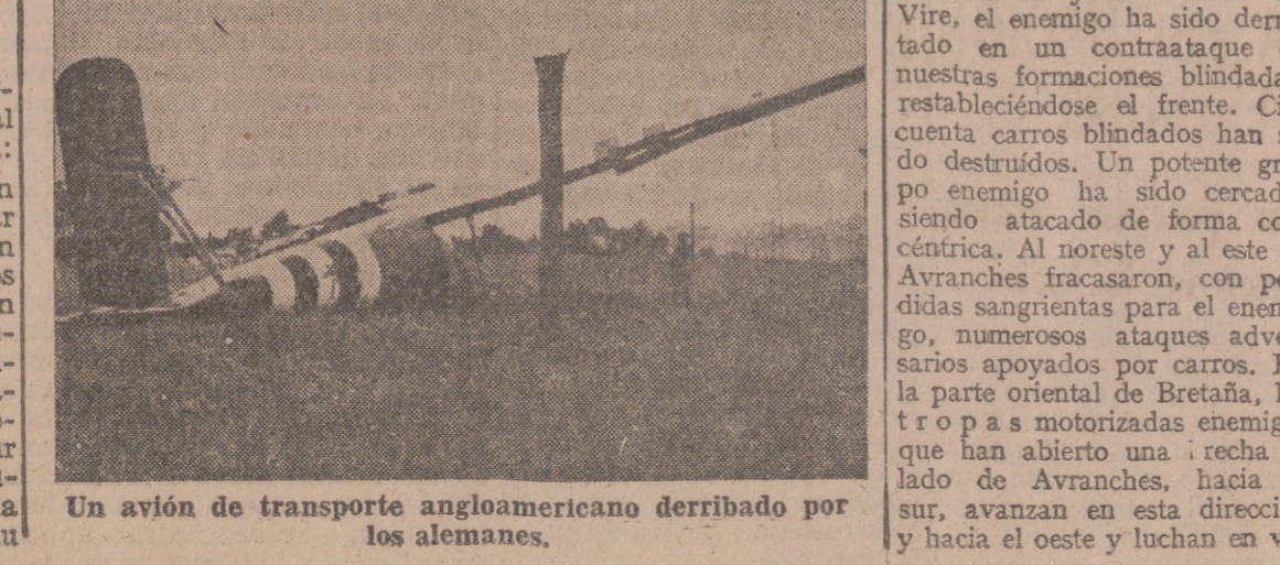
Un avión de transporte angloamericano derribado por los alemanes.