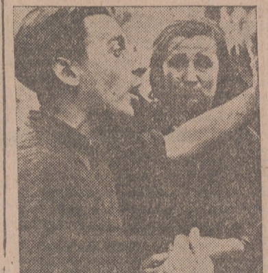
Población civil de una ciudad bombardeada de Normandía en cuyos rostros se reflejan los horrores pasados