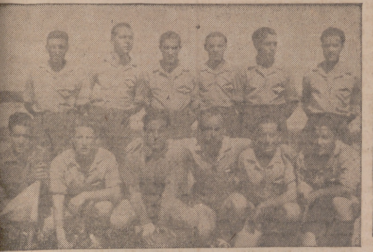
Equipo del A. Aviación Deportivo el día de su presentación en el Estadio Municipal.