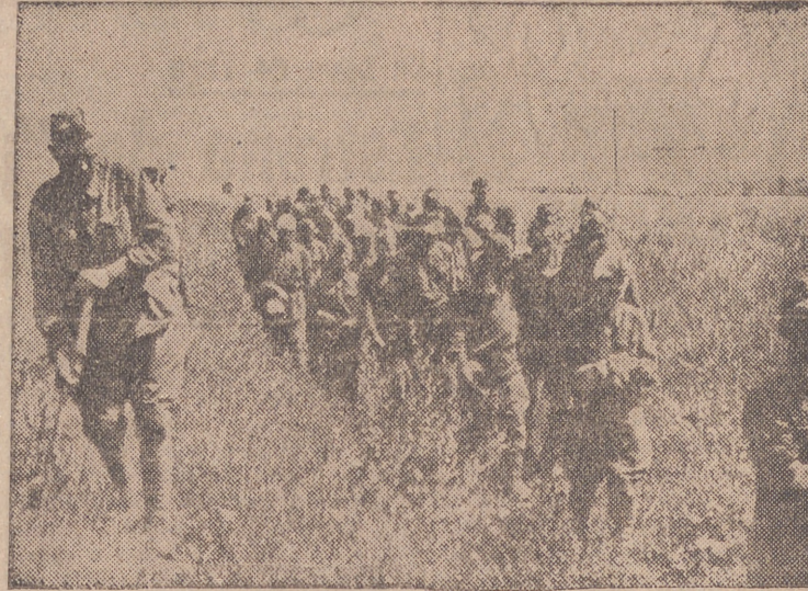
Después de un encarnizado combate contra el enemigo, han capturado los alemanes gran cantidad de soldados rusos, que agotados y raídos caminan hacia el campo de concentración.