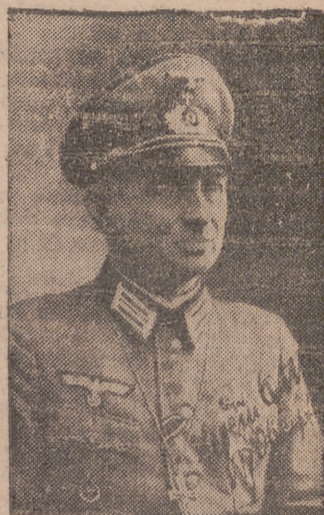
Un cura castrense alemán con su uniforme del frente en el Este.