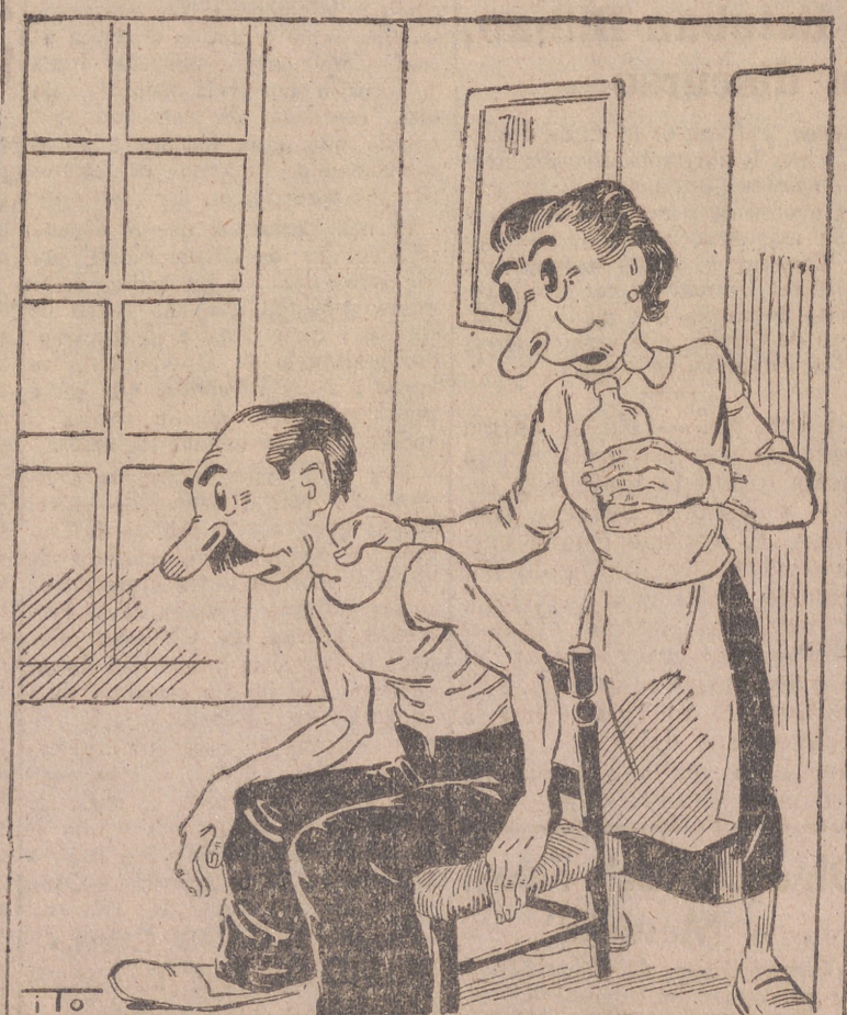
NOBLADO DE VIENTO EN LA MADRUGADA (Por ITO) —No dirás ahora que no andas por ahí hasta altas horas de la madrugada. ¡A ver, si no, cuándo has podido coger, tú este aire!

—No dirás ahora que no andas por ahí hasta altas horas de la madrugada. ¡A ver, si no, cuándo has podido coger, tú este aire!