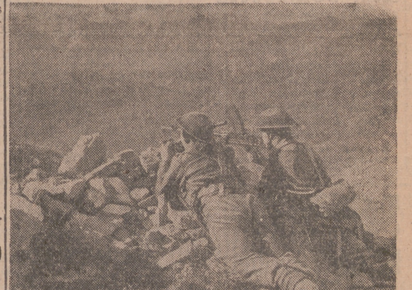
Un ametrallador y un observador inglés, apostados en una montaña, vigilan las posiciones enemigas en un lugar del frente italiano.