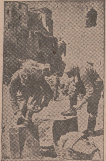
1.000 metros detrás de la línea de combate, estos soldados alemanes limpian sus botas pesadas.