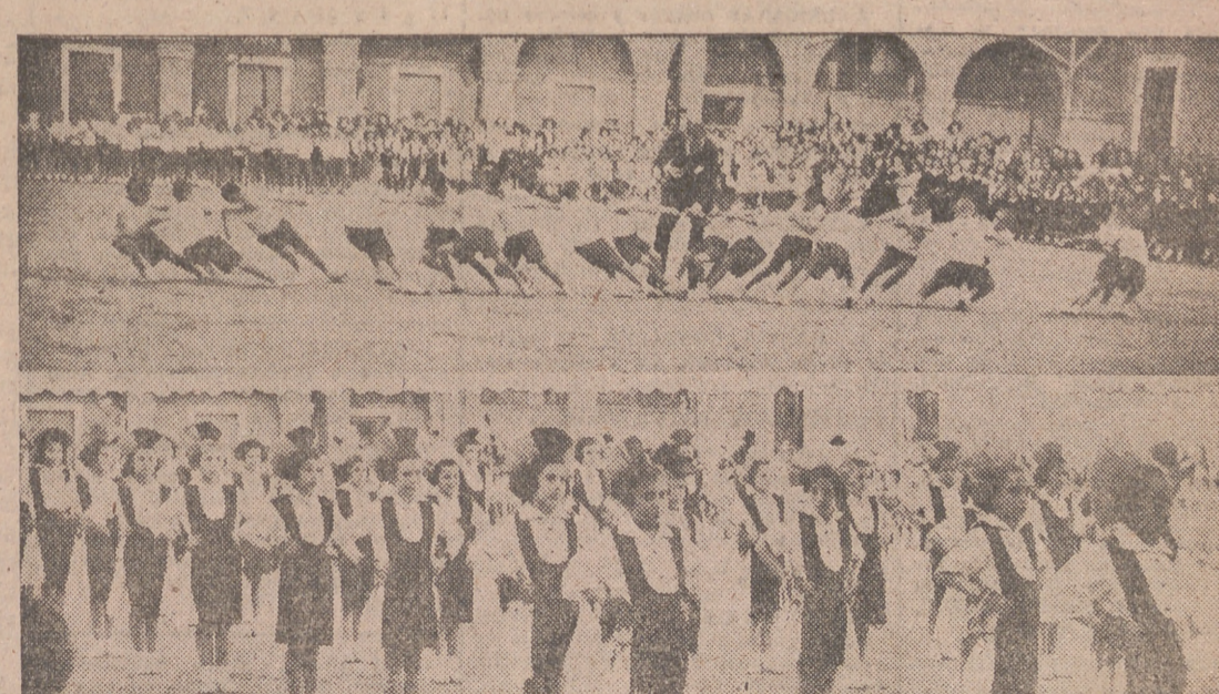
Los momentos del festival gimnástico celebrado el domingo en el Orfanato con motivo del final de curso.

Antiguos Alumnos de los Hermanos de las Escuelas Cristianas EXCURSION A BUJEDO Organizada una excursión a Bujedo para el domingo, 9 de actual se ruega a los exalumnos que quieran concurrir se alicien antes de viernes, 7, en la farmacia del señor Calvo y Criado, General, Mols, 17, donde recibirán detalles y pormenores. LA COMISION