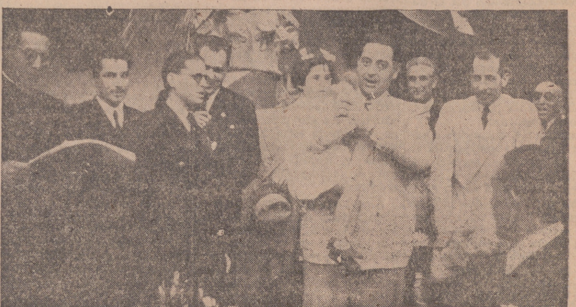
Un momento del reparto de premios efectuado el domingo en el Orfanato Provincial con asistencia de nuestras primeras autoridades.