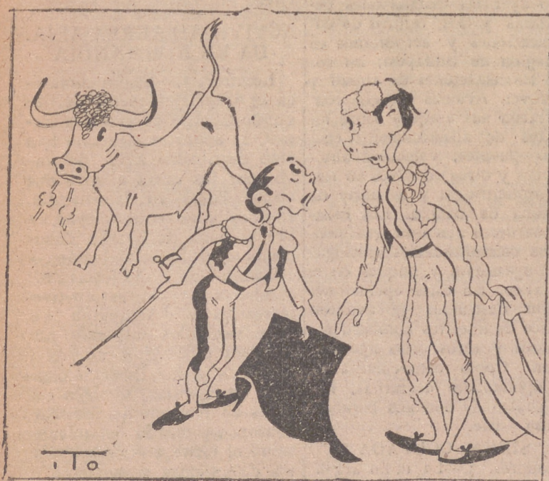
CORRIDOS CON REGALOS.—Por ITO —Vamos, que te ha tocado un buen «regalito». —¿Sí...? ¡Pues dí que lo cambio por un jamón o por una bicicleta!

La asamblea eligió presidente permanente de la conferencia a Henry Morgenthau, secretario del Departamento de Tesorería de Washington. Este pronunció un discurso en el acto de la toma de posesión.—Efe.