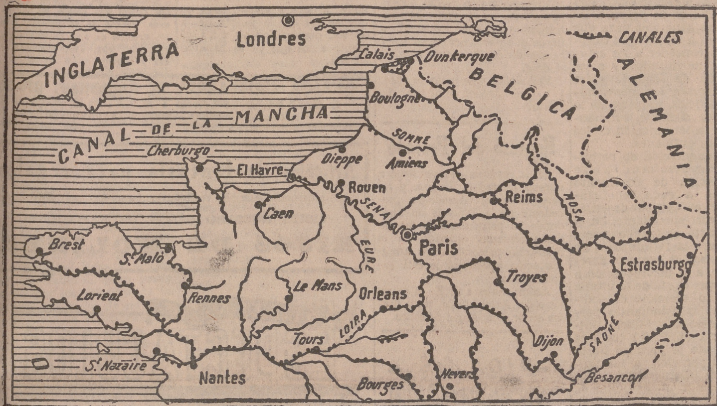
MAPA DE LAS OPERACIONES DE DESEMBARCO.

Cuartel General del Cuerpo expedicionario aliado, 6.—En comunicado oficial dice: «Bajo el mando del general Eisenhower, fuerzas navales aliadas, apoyadas por poderosas formaciones aéreas, iniciaron esta mañana el desembarco de los ejércitos aliados en la costa septentrional francesa.»—Efe.