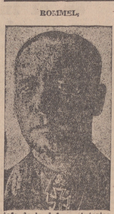
jefe de la defensa interior del Continente europeo.