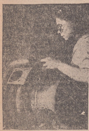
Obra de una de las grandes fábricas alemanas en que los gosógenos son cons-truidos.

francesa y de las baterías que en ella tienen instaladas los alemanes—dice el enviado especial de la Agencia Reuter cerca del Cuartel General del Cuerpo expedicionario aliado.—El bombardeo desde cerca de dichas baterías de las defensas costeras ha sido encargado a los destructores y barcos especiales de apoyo y a las barcazas de desembarco. Las tropas de desembarco tendrán que atravesar poderosas defensas alemanas. Las unidades de desembarco van apoyadas por las flotas británica y norteamericana. Casi la mitad de las barcazas de desembarco británicas van mandadas y tripuladas por marinos ingleses y en alguno de los barcos que transportaban infantería ondeaba la bandera de la Marina mercante británica. Para protegerse contra ataques aéreos todos los navíos—tanto de guerra como de desembarco—van armados con baterías antiaéreas y armas cortas. Sin embargo, la defensa principal de la Armada de invasión la constituye las aviciones británicas y norteamericanas. Por lo tanto, la tarea principal de las flotas aliadas es la de repeler el ataque de los navíos de superficie alemanes. Las fuerzas navales de que disponen los alemanes en el sector atacado no son muy importantes, pero hay