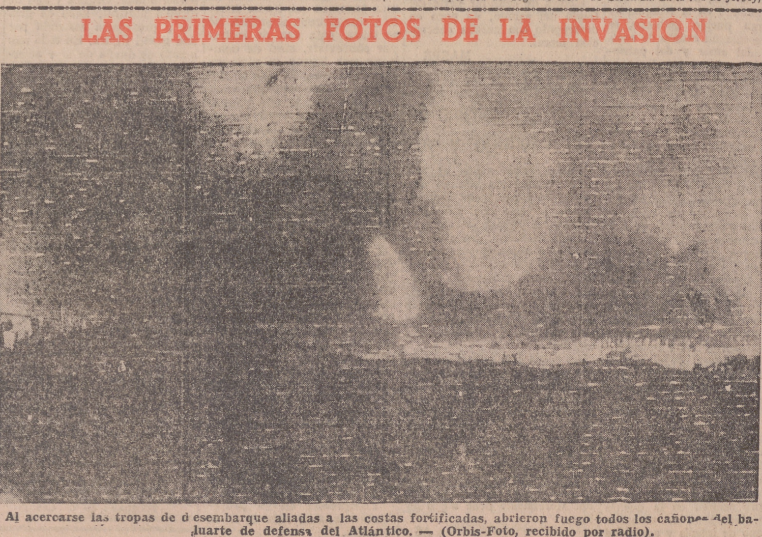
Al acercarse las tropas de desembarco aliadas a las costas fortificadas, abrieron fuego todos los cañones del baluarte de defensa del Atlántico.

Ayer publicó LIBERTAD un número extraordinario dedicado a los últimos acontecimientos internacionales de la invasión aliada al Continente europeo, que fué acogido con gran interés por todos los vallesoleños que en esos momentos transitaban por las calles de nuestra ciudad, siendo los ejemplares materialmente arrebatados de las manos de los vendedores. El esfuerzo de LIBERTAD se vio así compensado por el gran número de lectores de esta edición especial.