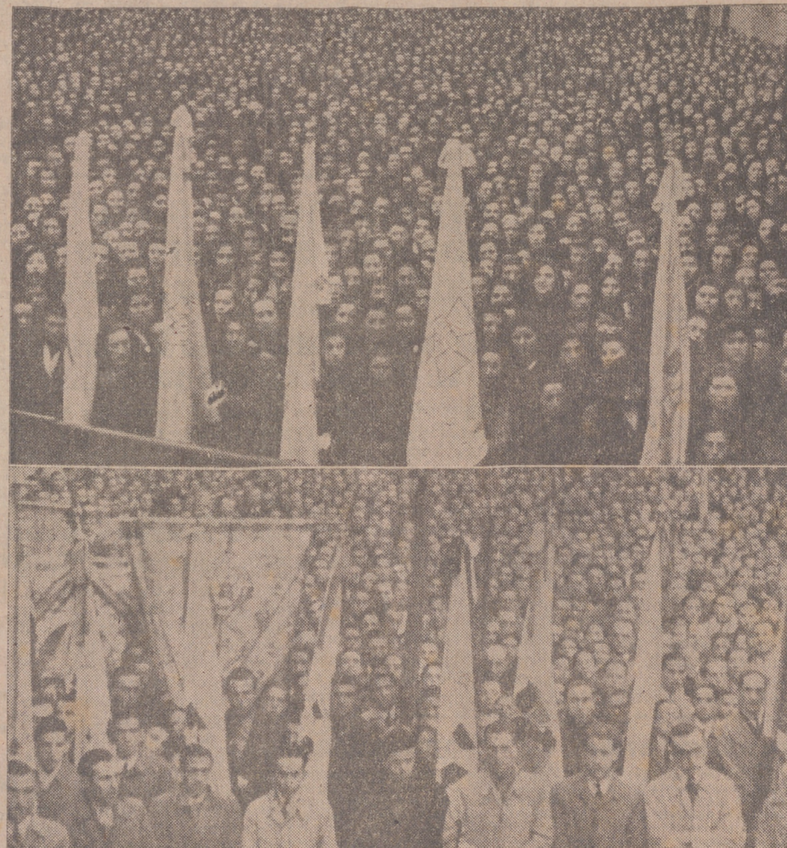
Imponente aspecto de la manifestación de hombres y mujeres de Acción Católica que, juntamente con miles de vallisoletanos, acudieron a por el solemne Rosario de la Aurora para rogar a Dios por la Paz y el Papa.