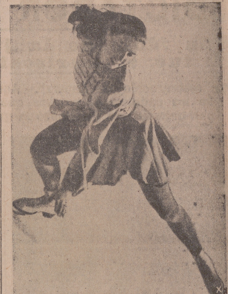
La joven campeona Ursula Arnold durante su brillante exhibición.—(Orbis-Foto).