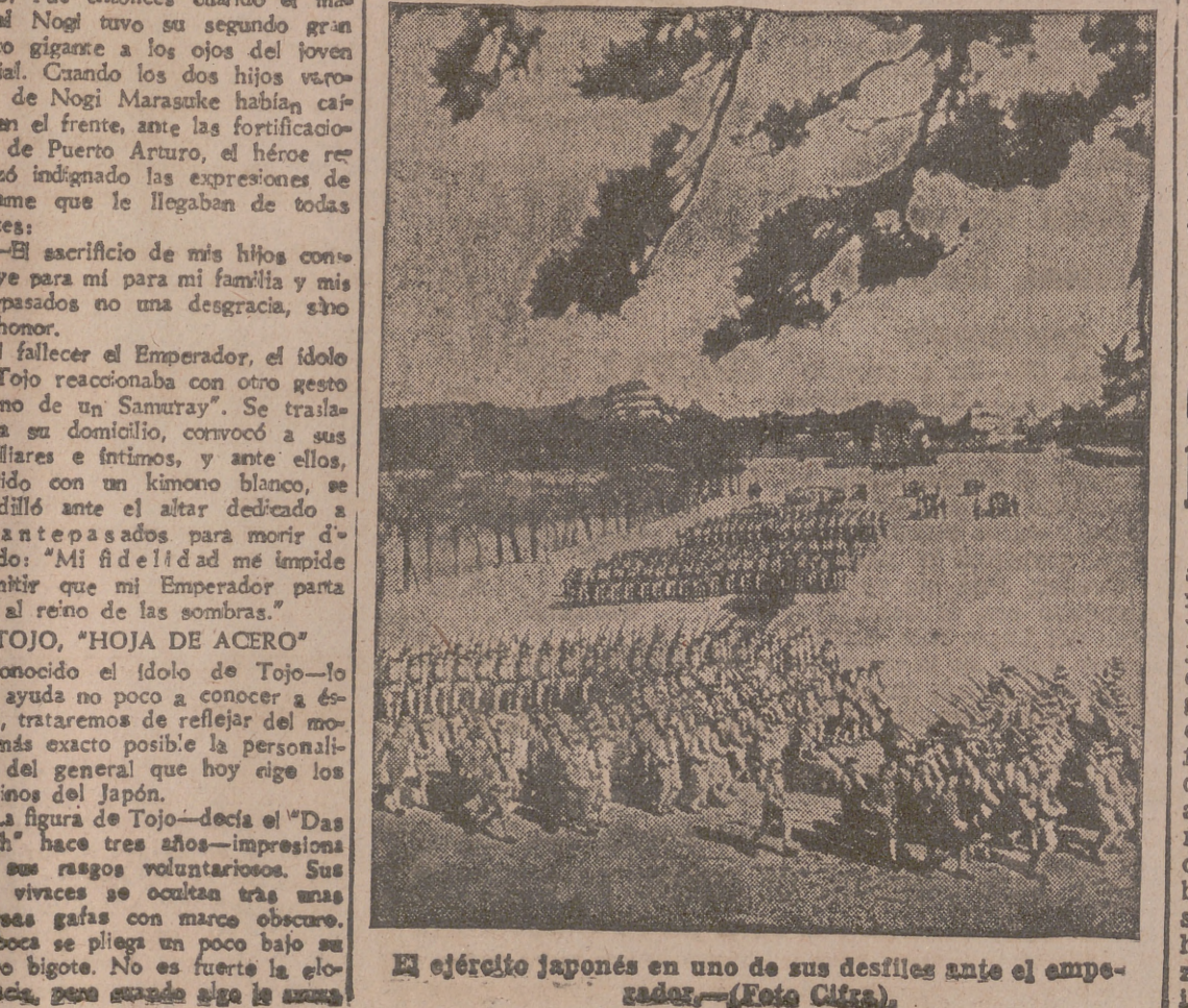
El ejército japonés en uno de sus desfiles ante el emperador.

Berlín, 27. — En todas las provincias alemanas se ha celebrado hoy el ingreso de las juventudes hitlerianas en el partido nacional-socialista. Con tal motivo, el jefe de las juventudes del Reich, Axmann, ha pronunciado un discurso, en el que, entre otras cosas, dijo que era hoy un día solemne, especialmente para los jóvenes de uno y otro sexo que, después de haber realizado las oportunas pruebas, han sido admitidos en el Partido Obrero Nacional-socialista. — Efe.