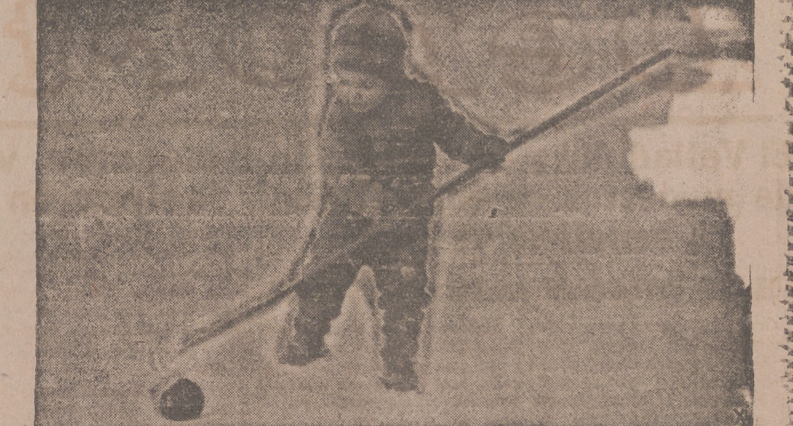
Los pequeños evacuados de las grandes ciudades alemanas en peligro de ser bombardeadas, disfrutan de las alegrías del campo invernal.