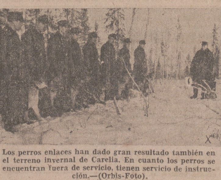
Los perros enlaces han dado gran resultado también en el terreno invernal de Carelia. En cuanto los perros se encuentran fuera de servicio, tienen servicio de instrucción.—(Orbis-Foto).