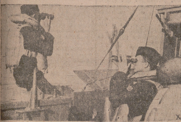
Desde el puente vigila el centinela alemán incansablemente el mar en busca de barcos enemigos.