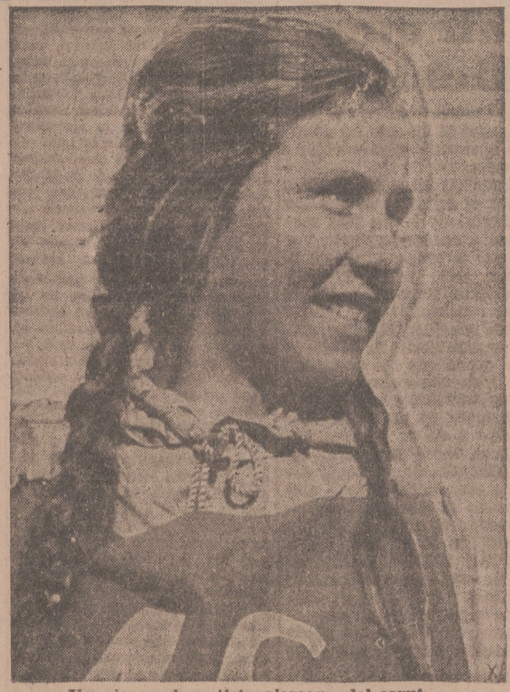
Una joven deportista alemana del esquí.