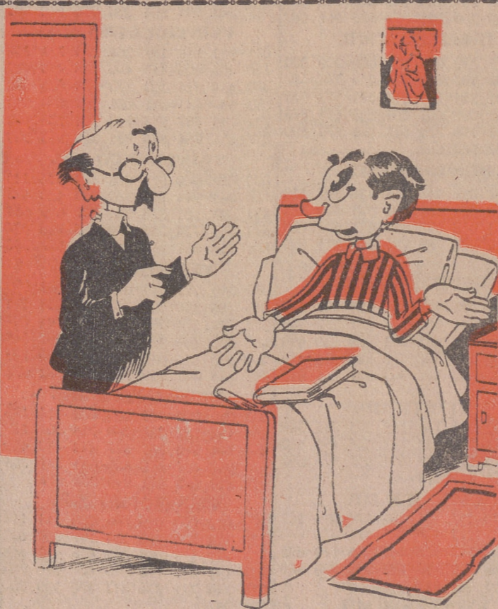
MEDICINA DESAGRADABLE, por ITO —Y ya sabe usted, señor Fernández, su medicamento, aunque sepa mal, es para uso interno.—Bueno, pues si es para interno no lo tomo; ya sabe que soy medio pensionista.

Los acontecimientos que sucedieron muchos años después de la independencia búlgara, y que empañaron las buenas relaciones de Rumania y Bulgaria, no dejaron huellas tan profundas que no pudiesen ser canceladas. Fueron pasajeros, y nuevas circunstancias y acontecimientos los van relegando poco a poco en el olvido.