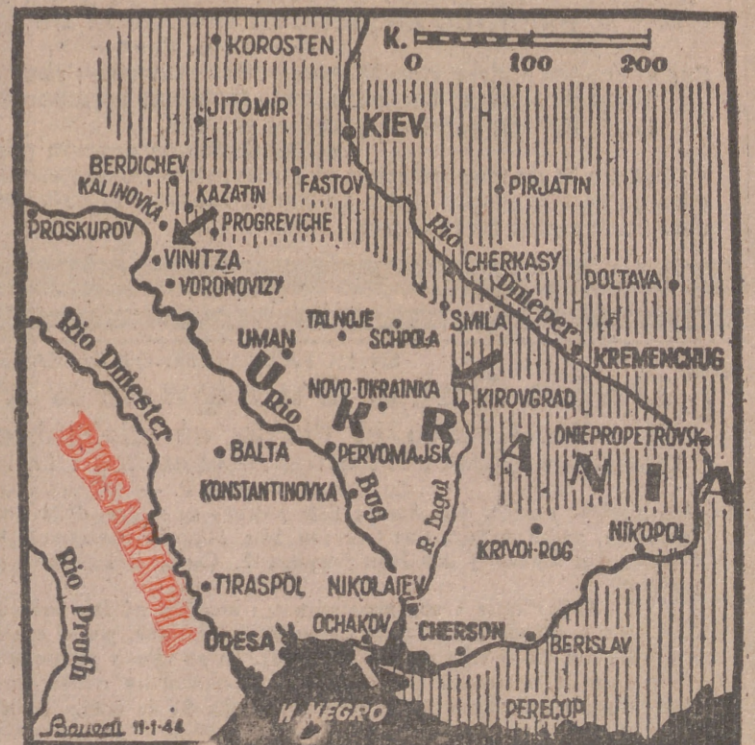
Situación aproximada actual en la zona de los principales combates.