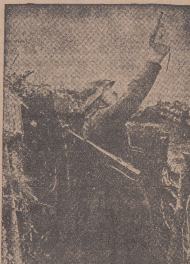
El enemigo ataca en masa una importante posición alemana. El suboficial da la señal de alarma con la pistola luminosa a los lanzagranadas pesados, los cuales abren inmediatamente un fuego de barrera. El ataque de los bolcheviques es rechazado sangrientamente.