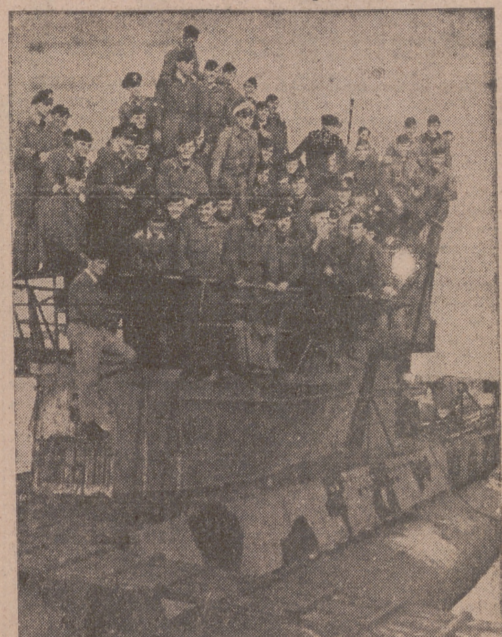
El teniente capitán von Schippenbach, comandante de submarinos en el Mediterráneo, fué condecorado con la Cruz de Caballero de la Cruz de Hierro. Hundió en trece navegaciones contra el enemigo, como comandante, 58.000 toneladas y torpedó 20.000. Nuestra «foto» muestra al glorioso comandante rodeado de su tripulación en la torre de su barco.