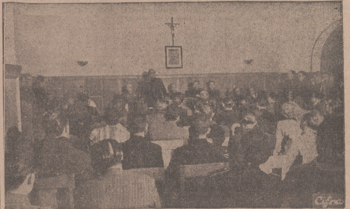
Madrid.—Con asistencia del vicesecretario de Educación Popular y del delegado nacional de Prensa se ha inaugurado el nuevo edificio de la Escuela Oficial de Periodismo.—El delegado nacional de Prensa, camarada Juan Aparicio, durante su discurso.