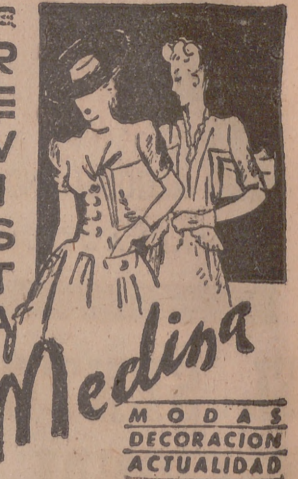
Administración: Carretera, 10. Madrid.

Calderón.—A las 7,15 y 10,30. "Antes de entrar, dejen salir", en español (estreno) y "Escolares descañados". Capitol.—A las 7,30 y 10,30, Compañía de ópera flamenca. "Embrujo de Andalucía". (Despedida). Carrón.—A las 7,30 y 10,30, No-Do y "Sospecha", en español. Coca.—A las 7,30 y 10,30, No-Do y "Mi marido está loco", en español. Lafuente.—A las 7,30 y 10,30, No-Do y "Amor", en español. Lope de Vega.—A las 7,15 y a las 10,30, "El verdugo de Sevilla". Pradera.—A las 7,30 y 10,30, Complemento, en español, y "Los del Norte", en español. (Estreno). Roxy.—Desde las 8, "Blanca Nieves y los siete enanitos", en español, y "Escolares descañados".