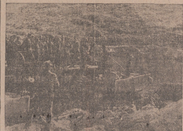
Los cazadores de montaña alemanes se disponen a ocupar una isla.