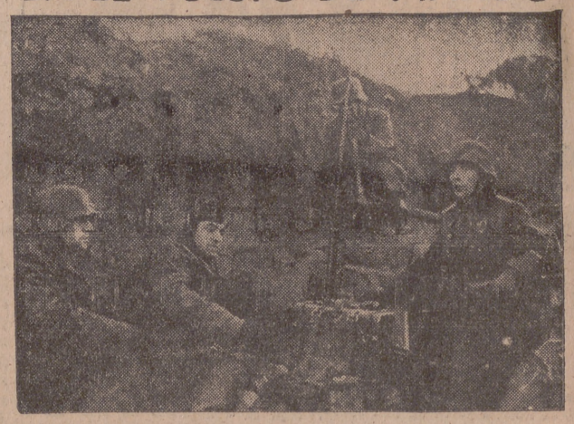
Durante el contraataque, las órdenes son dadas a los tanques alemanes desde el puesto de mando por medio de la radio.