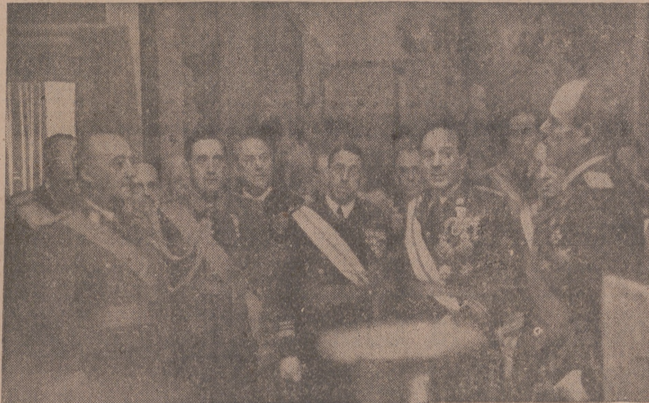
Con ocasión de celebrarse la tradicional Pascua militar, los ejércitos de Tierra, Mar y Aire han ofrecido a S. E. el Jefe del Estado y Generalísimo un bastón de mando y un álbum que contiene las firmas de los ministros del Ejército, Marina y Aire y de todas las jerarquías militares. Hizo la ofrenda el ministro del Ejército.