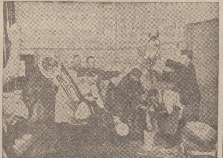
Se celebra estos días en Alemania el 75 aniversario de la fundación de una Escuela Veterinaria del Ejército, montada con los más modernos adelantos. En fotografía vemos un aspecto de la sala de Rayos X en el momento que se está sacando una radiografía en la pata de un caballo.

Las animosas juventudes universitarias de España, que entran en sus estudios con el entusiasmo de servir a la Patria, lo mismo que los que han recibido recientemente sus títulos académicos, tienen ante sí una misión que cumplir, y es la de enfrentarse con la leyenda negra. Mucho se ha hecho ya, por españoles y extranjeros, para poner en evidencia las falsedades e imposturas difundidas por los enemigos de España y los ignorantes de nuestra Historia. Pero queda todavía mucho por hacer y precisa contestar y contrarrestar los nuevos capítulos que continúan añadiéndose a las ya conocidas acusaciones y tergiversaciones contra nosotros.