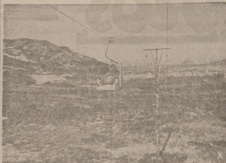
Sobre las cimas de los montes se desliza este soldado alemán, conducido por el cable del ferrocarril aéreo de servicio en el frente del Norte oriental.