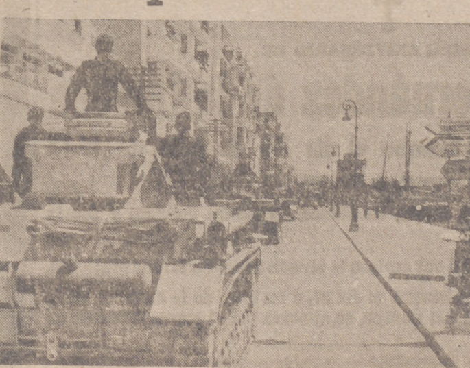
Potentes carros alemanes, en marcha desde los muelles de Galoniki.