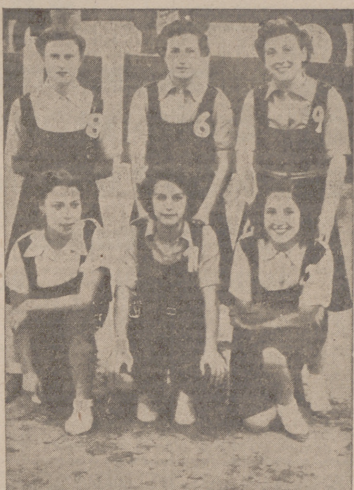
Las jugadoras madrileñas que el miércoles fueron derrotadas por el equipo asturiano en refiido encuentro