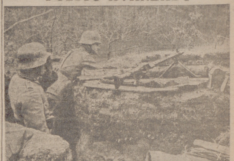
Los soldados destacados en estos puntos de vigilancia y resistencia sostendrán el primer ataque de los enemigos.