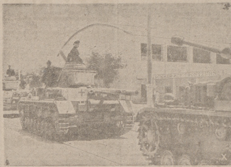
Tanques alemanes trasladándose en columna hacia las costas del Mar Egeo.