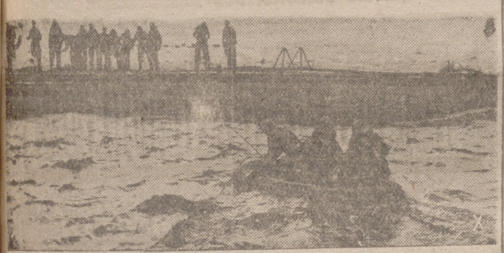
Desde el submarino es trasladado a bordo del buque de aprovisionamiento un miembro de la tripulación enfermo.