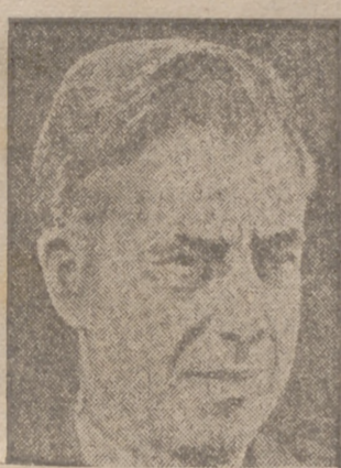
Wallace, vicepresidente de los Estados Unidos, que realiza actualmente un viaje por América del Sur