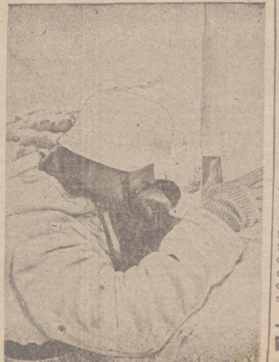
Con un espejo de trinchera, este soldado alemán puede observar las posiciones del enemigo a una distancia de apenas cien metros