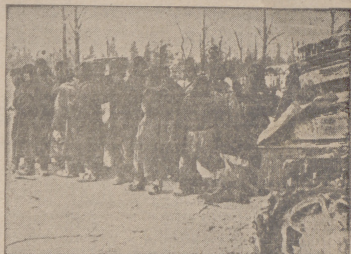
Soldados rusos capturados por las tropas alemanas en el sector de combate del lago Ladoga. Apáticos e indiferentes, miran a su alrededor; ni siquiera por el camarada herido que yace en el suelo se preocupan