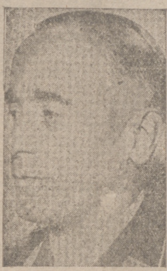
Von Tschammer Un Osten, jefe de los Deportes de Alemania, recientemente fallecido