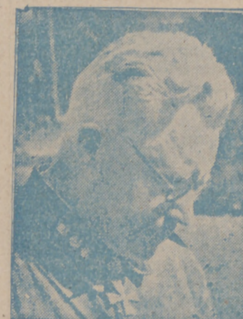
jefe de la defensa de las costas de Finlandia.