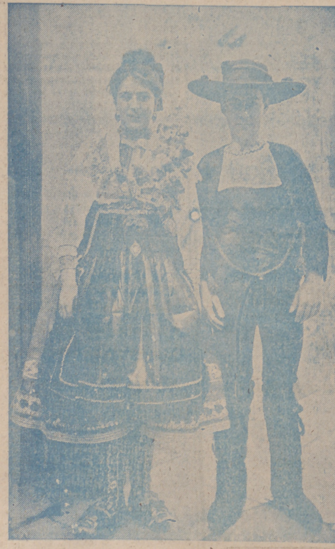
UNA PAREJA DE "CHARRROS" CON SUS TRAJES TÍPICOS