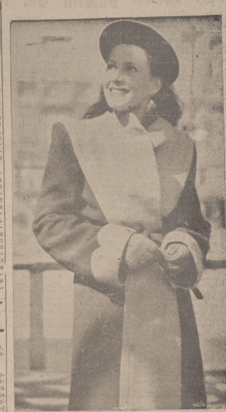
Abrijo—modelo alemán—marrón tostado, adornado con gris