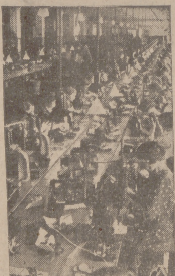
Mientras el soldado alemán lucha heroicamente en el campo de batalla, contribuye la Patria con todas sus fuerzas a la victoria de sus armas. He aquí el aspecto que ofrece la sala de una fábrica alemana