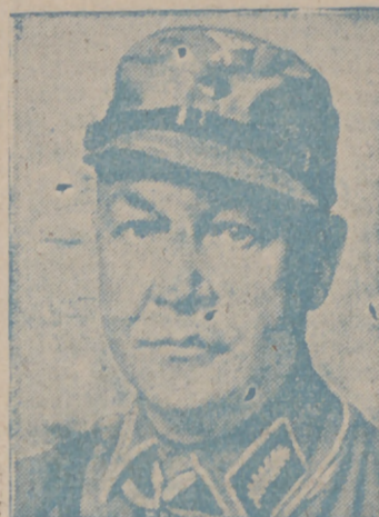
general alemán, que opera en Túnez en estos días.