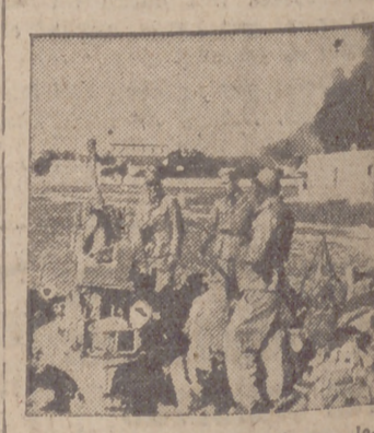
Artillería anti-érea ligera alemana en posición de fuego.

Las misiones están en los suburbios. Hacen falta cañones. La obra "Pan y C. teclamo" pide colaboración apostólica. Ayuda a formar la conciencia cristiana de los trabajadores.