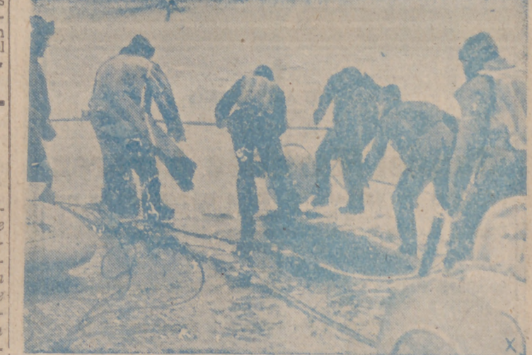
Muy difícil es la traviesa en los pequeños barcos buscaminas. He aquí a los marinos alemanes durante su nada fácil trabajo, a pesar del hielo y del frío