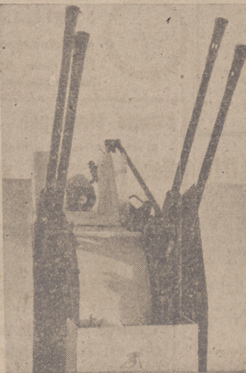
Artillería antimotora de cuatro tubos, del más reciente modelo, defendiendo los puentes y caminos del frente ruso.