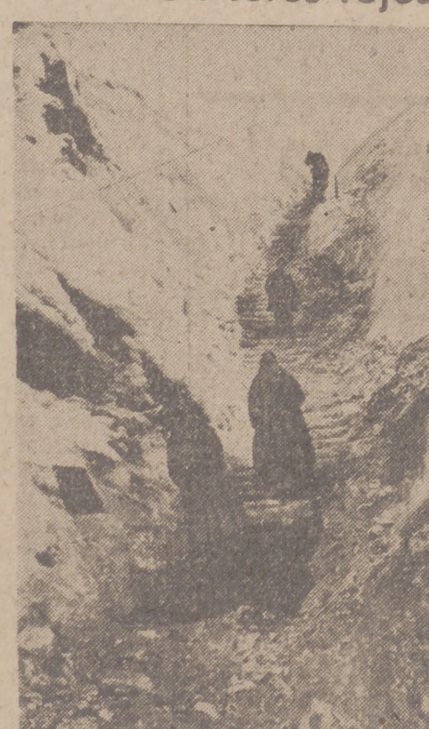
En el sector central del frente del Este, un grupo de prisioneros soviéticos construyen trincheras y posiciones defensivas.