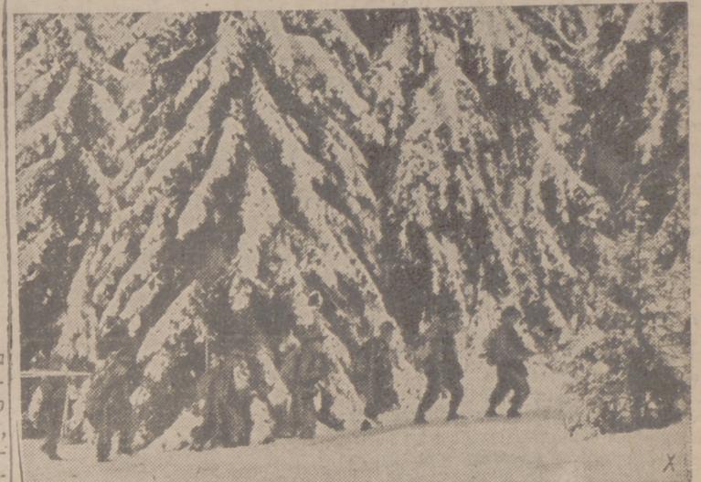
Grandes nevadas han cubierto los bosques de abetos, por donde avanzan los intrépidos cazadores de las S. S. alemanas.