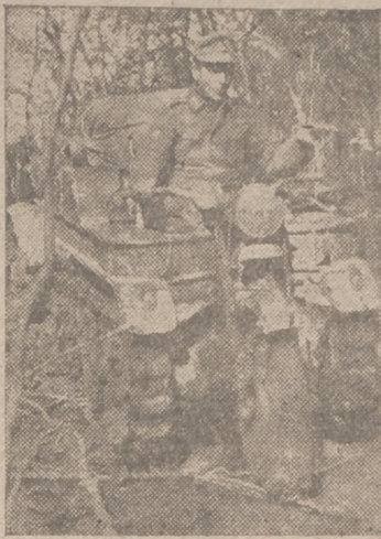
Con la moto oruga a través de los bosques virgenes al Noroeste del Cáucaso. Es esta moto oruga aquí completamente indispensable para los soldados alemanes, pues con ella puede atravesarse por los peores terrenos

El ministro de Industria y Comercio entrega las insignias de Isabel la Católica al secretario general técnico del Ministerio