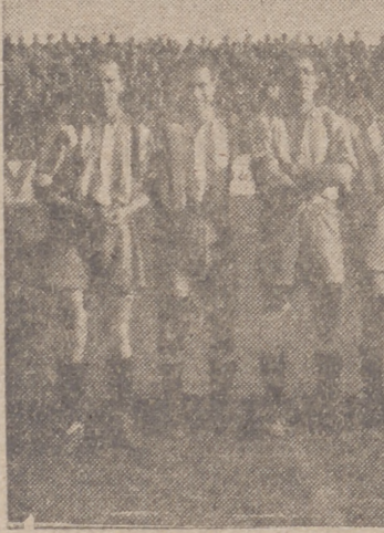
Equipo del Real Gijón