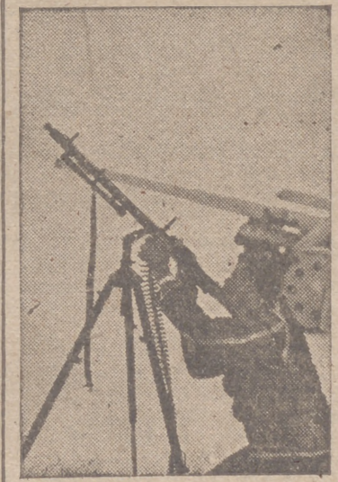
Defensa anti-aérea en una batería alemana. Ni un instante déjase de la vista el cielo donde, de repente, pueden surgir aviones enemigos