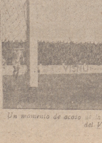
Un momento de acoso de la defensa asturiana a la patria del Valladolid