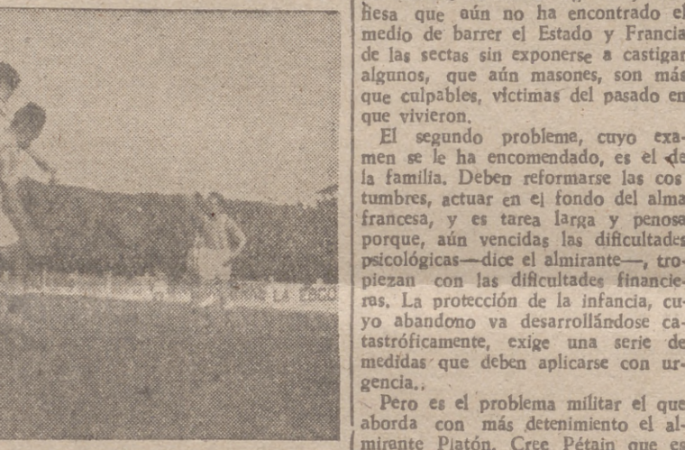
La defensa asturiana corta un buen pase de Barinaga