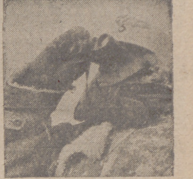
En un instante déjase de vista el cielo, pues cualquier descuido sería grave. Tan pronto divisa el centinela un avión, da parte de ello a la batería.