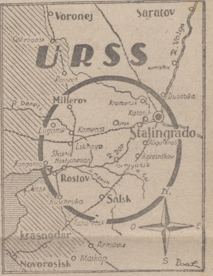
El episodio de Stalingrado—suprema lección de virtudes militares—es ya reconocido aun por los propios enemigos. Después de muchos días de acoso y de incansables combates, la bandera del Reich ondea aún sobre los montones de escombros. En lucha heroica y desigual han sucumbido con honor las fuerzas que defendían el sector Sur de la población; en el sector Norte aún hay vidas, lo que quiere decir que aún hay resistencia encarnizada, que no cesará sino con el último aliento del postrer combatiente.

Entre el Cáucaso y el Don se registraron encuentros de nuestras vanguardias con las vanguardias adversarias que presionan ligeramente por lo que los movimientos del grupo de nuestras fuerzas se llevan a cabo con facilidad. En el frente del Donets y