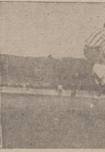
La defensa asturiana corta un buen pase de Barinaga