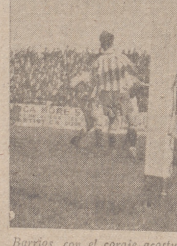
Barrios, con el coraje acostumbrado, salva una difícil situación ante la puerta de Ispizua