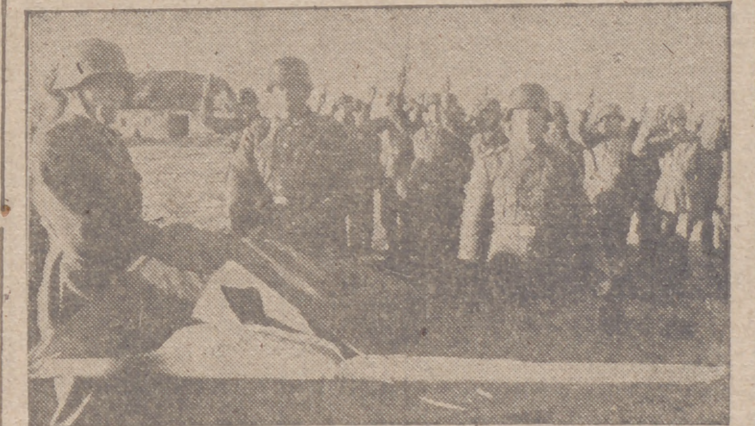
Después de durísimos combates contra el bolchevismo, los cosacos han probado su fidelidad y prestan ahora su juramento a las fuerzas armadas alemanas.

El hispanismo es decir, el retorno a nuestro propio ser y la reconquista de nuestra personalidad, es para nosotros, hispano-americanos, no ya una doctrina de libertad, sino la libertad misma, la única forma posible de poseerla y gozarla en su plenitud. España lucha y ha luchado siempre por la libertad de pensar, de creer, de obrar y juzgar a su modo, a la española. Y por querer vivir a la española, conforme a su estilo y a su manera de ser, ha sido intránsito frente a todos aquellos que quisieron imponerle otro modo de pensar, de ser y de sentir. Se piensa y se siente tal como cada hombre es, y tal como cada país es. De la misma manera que individualmente los dissonantes de cuanto no concorda con nuestro espíritu y repelamos cualquier imposición de esta índole, así también España ha rechazado todas las influencias que pretien-