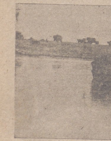
Durante la temporada de lluvias en la Africa del Norte, el agua ha inundado todos los campos transformándolos en grandes lagos, a través de los cuales pasan los soldados alemanes con sus camiones cargados con material de guerra.