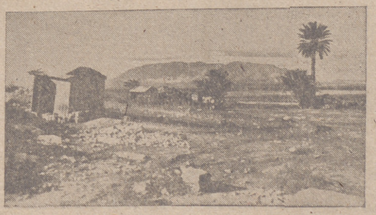
Numerosas posiciones defensivas enemigas en Túnez han sido conquistadas por las tropas alemanas. La fotografía muestra una de estas posiciones después de la conquista. Entre las primeras distingúense tanques alemanes camuflados que llevaron a cabo la ocupación.