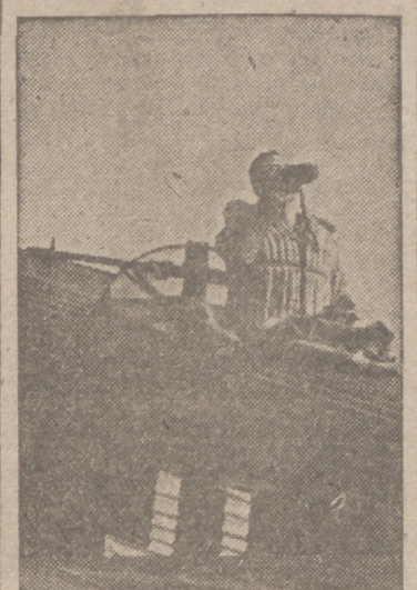
Los breves momentos necesarios para efectuar la descarga del aprovisionamiento para las tropas alemanas en Túnez son aprovechados por el aviador alemán para tomar de prisa el desayuno, ya que momentos, después ha de iniciar nuevamente el vuelo