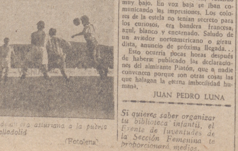
Un momento de acoso de la defensa asturiana a la patria del Valladolid