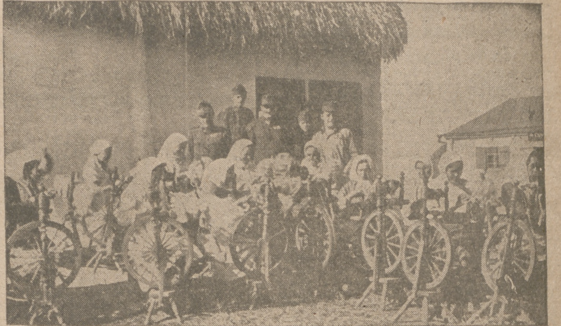
Durante su trabajo, con interés contemplan los soldados alemanes sus tareas.