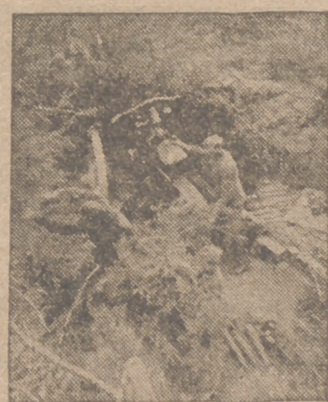
Poco antes del ataque contra las posiciones enemigas en el frente del Este, los soldados alemanes sacan el camuflaje de su cañón.

"...Si querido fué el ¡Viva España! con que tantos héroes sucumbieron en la época de la decadencia de la Patria, el ¡Arriba España! es el grito de hoy, el de nuestros muertos, el de los que no se conforman con que viva, sino que la quieren ver arriba."