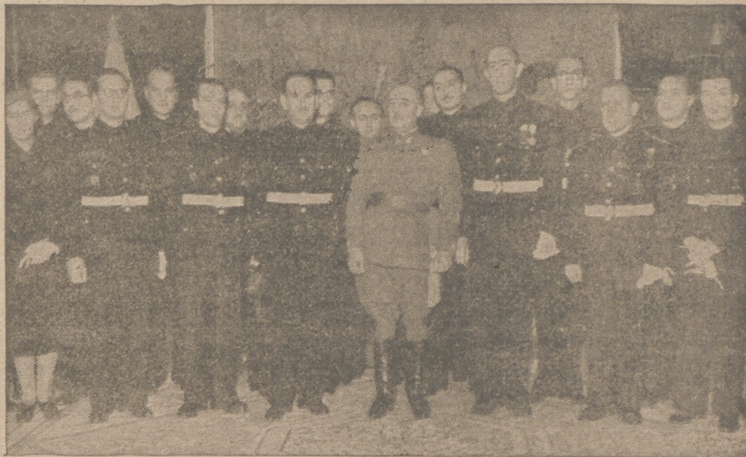
MADRID.—El ministro secretario del Partido, camarada Arrese, con los vicesecretarios y delegados nacionales de Falange Española Tradicionalista y de las J. O. N.-S., son recibidos en audiencia por S. E. el Jefe del Estado, Generalísimo Franco, para felicitarle con motivo de su cumpleaños.