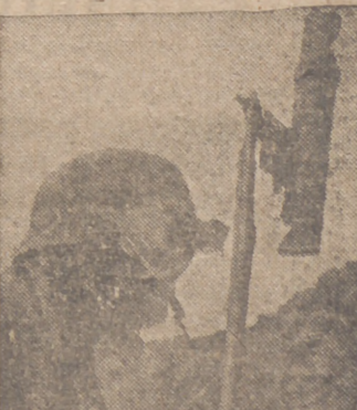
Puesto de observación alemán en el frente del Terek