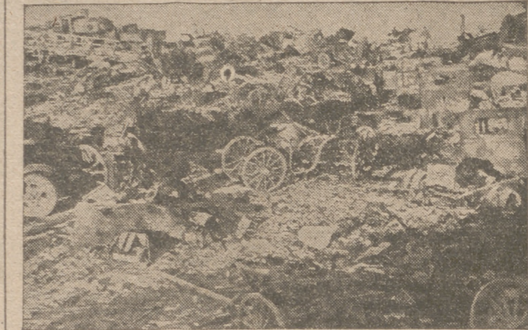
A orillas de este río fué derrotado completamente un Cuerpo de ejército soviético por los cañones y bombarderos alemanes.