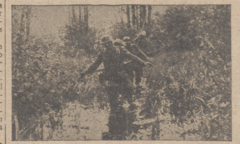
También durante el verano en algunas regiones del Centro y Norte de Rusia se encuentra el terreno, a causa de las lluvias, en estado de pantano, lo cual ofrece inmensas dificultades a las tropas alemanas en su avance. La foto muestra a unos infantes alemanes avanzando a través de un bosque ruso que es un completo pantano

comienzo el acto de entrega de los títulos. Primeramente, el director general de la aviación civil dirigió unas palabras a los alumnos, que se hallaban formados ante el pabellón de la escuela, y a continuación les entregó los títulos, en número de 95, distribuidos de la siguiente forma: 27 títulos de la clase A, 53 de la B y 15 de la C. Esta promoción ha realizado los siguientes servicios: 4.487 vuelos, con un tiempo total de permanencia en el espacio de 330 horas y 49 minutos, habiendo sufrido solamente diez roturas de aparatos y un solo accidente en tierra de carácter leve.