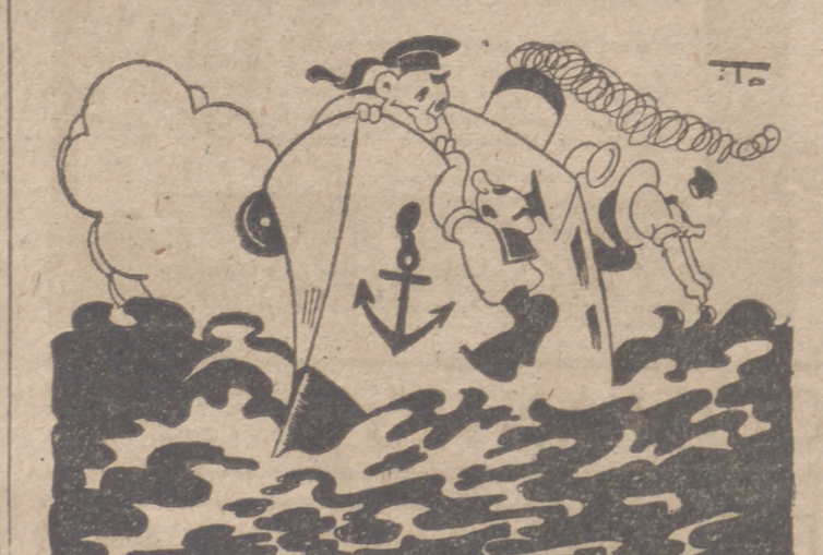
NAUFRAGIO. por ITO