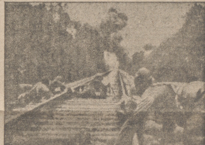
Una avanzadilla nipona avanza a lo largo de un ferrocarril

Por su parte, la ruta marítima hacia Rangún y al mismo tiempo todos los transportes auxiliares para Chung-King por la carretera de Birmania se verían imposibilitados en el caso de proseguir el avance japonés. La pérdida de Australia como arsenal de guerra del Imperio británico se traduciría en una nueva carga para la industria metropolitana. Últimamente han ocurrido bastantes descalabros y, aparte de esto, surgen quejas por doquier: Batavia se duele de la falta de cohesión entre las fuerzas holandesas y las británicas; un informe de Singapur habla de rozamientos entre la población civil y las autoridades militares. Todo ello demuestra hasta qué punto se está por debajo de las exigencias de una situación seria y no hay que extrañarse de que en Australia, en particular en la Prensa, se expresen severas críticas para la dirección británica y norteamericana de los asuntos del Pacífico y del Continente de no echar en saco roto el descontento general".—Efe.