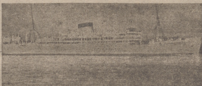
El acorazado auxiliar inglés «Garnarvon», que tuvo que refugiarse en un puerto de la América del Sur a consecuencia de las graves averías recibidas en un combate con un acorazado alemán