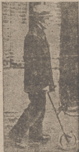
Los holandeses son, quizá, el pueblo que más ingeniosamente sabe resolver los problemas creados por la guerra. Para evitar el gasto de pilas eléctricas han inventado esta económica autolinterna, de la que van provistos los transentes. El curioso aparato sirve, a la vez, de lámpara, bastón e iluminación de petineta.