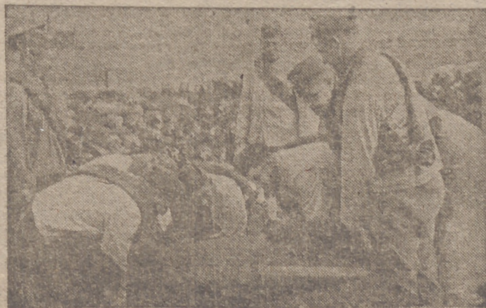
Soldados de un aeródromo alemán cargando bombas pesadas destinadas para las islas británicas

«Desde el comienzo del conflicto chino-japonés hasta la fecha la aviación de la Marina nipona ha destruido en total 1.928 aviones chinos, 1.670 de los cuales son seguros y los otros 258 probables. Las pérdidas niponas se elevan solamente a 153 aviones».—Efe.