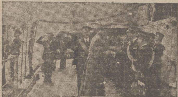
S. A. R. el príncipe de Piemonte visita al crucero italiano «Fiume»