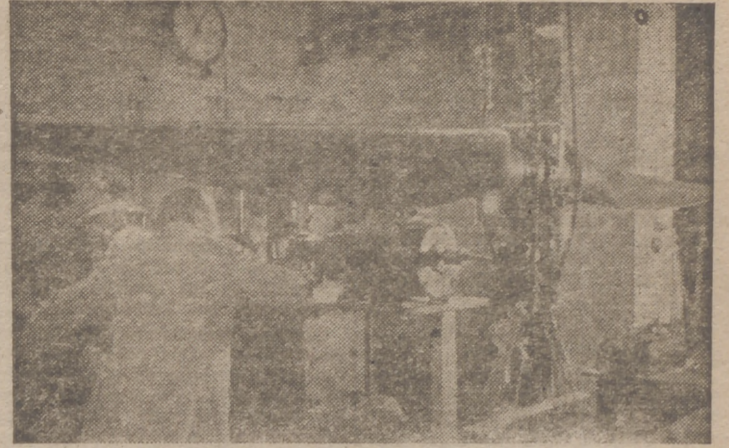
La industria aérea alemana, la primera del mundo.—Examen de una hélice recién fabricada

Para obtener la población de derecho y oficial es obligatorio que en cada término municipal se inscriba a todos los que conserven legalmente su residencia en él aunque a las doce de la noche del 31 de diciembre se hallen fuera del Municipio y aun fuera de España.