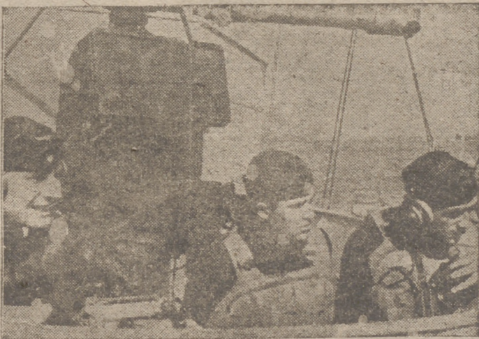
Día y noche patrullan los torpederos alemanes sobre el Canal de la Mancha y por las costas inglesas, coadyuvando a estrechar cada vez más el cerco que bloquea la isla

Madrid, 16.—El Consejo General de Prensa ha facilitado la siguiente referencia del Consejo de ministros: «El Consejo de ministros, bajo la presidencia del Jefe del Estado, se ha reunido esta mañana. Se aprobó una ley de reforma tributaria.—Cifra.