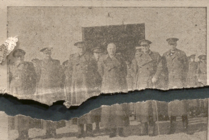
Madrid.—El ministro del Ejército, con el capitán general de la Primera Región y el gobernador militar de Madrid, asisten en el cuartel del Regimiento de Infantería número 1 a la ejecución de unas marchas militares seleccionadas en el concurso abierto por el Ministerio del Ejército

Ahora, en estos momentos decisivos y solemnes de la humanidad en que la guerra pone en peligro tantas cosas y una ola de materialismo amenaza al mundo, esa unidad ideal de Portugal y España, multiplicada en los jóvenes pueblos de la Hispanidad, es algo muy alto y muy nuestro que debemos fortalecer y propagar.