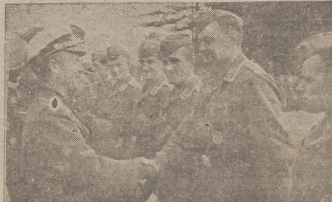
Muchos de los aviadores alemanes que tomaron parte en los últimos grandes ataques contra los centros industriales de Inglaterra fueron condecorados