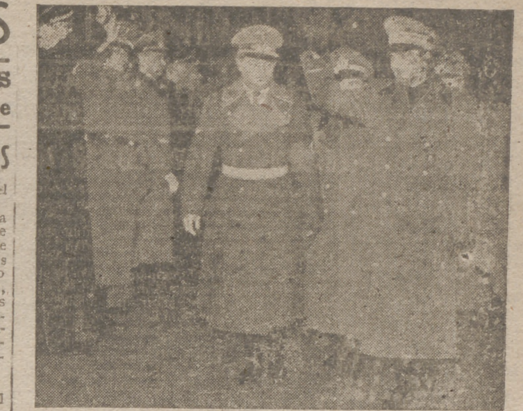
El ministro de Justicia de Italia, conde Dino Grandi, pasó unos días en Berlín invitado por el ministro del Reich doctor Frank (a la derecha)

Todas las especulaciones del enemigo sobre los posibles resultados de la actual batalla en África deben de ser consideradas como prematura. La lucha durará todavía una semana más, y sólo al