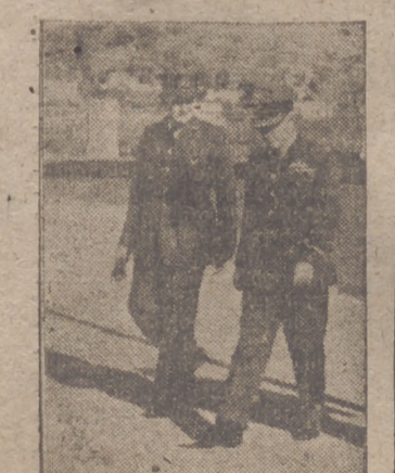
El mariscal inglés del Aire, Boyd, prisionero en Italia

Como nuevos titanes pretensores del dominio del mar, los submarinos adoptan ahora una táctica de ataque en masa para poder causar may y quebranto en las largas hileras de los convoyes de aprovisionamiento. Su empleo se asemeja al de las ligeras tanquetas de las operaciones terrestres.