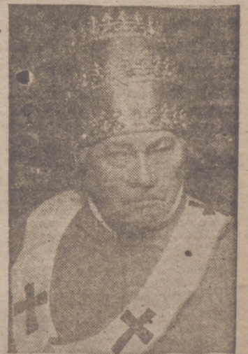
En Berlín ha sido estrenado con gran éxito el drama de Guido Kolbenheyer «Gregorio y Enrique» en el Schiller-Theater, con el célebre actor Paul Wegener en el papel de Gregorio

Está, a su vez, ilustrado con gran número de grabados, a fin de fijar mejor la riqueza artística que encierra la villa de San Felices.