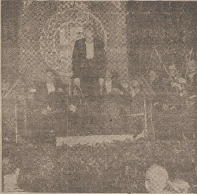
En Alsacia y Lorena, que bajo el nombre de Marca del Oeste Alabán de ser reincorporados al Reich, se desarrolla ya una intensa vida cultural alemana. El célebre director Hans Pfitzner, con la Orquesta Filarmónica de Munich, durante un concierto dado en la "Sangerhaus" de Estrasburgo

Termina Jesús poniéndoles en guardia contra la maliciosa interpretación de sus enemigos: «Bienaventurado aquel que no fue escandalizado en mí, y a continuación, a la inconstancia de tantos como escuchaban sus palabras, opone la fe inquebrantable del Precursor: «¿Qué salisteis a ver al desierto? ¿Una caña que es agitada por el viento? ¿Qué habéis, pues, salido a ver? ¿Un hombre cubierto de vestidos delicados? Mas los que llevan vestidos preciosos y viven en los deleites, habitan en los palacios reales. ¿Qué habéis, pues, salido a ver? ¿Un profeta? Sí. Yo os digo; y más que un profeta. El es, de quien está escrito: He aquí que envío mi mensajero delante de tu faz para preparar los caminos delante de tí».