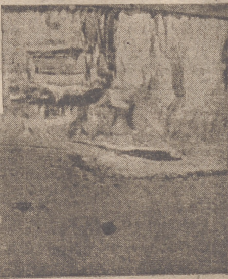
Cazas alemanes de guardia en las costas del Canal

Berlin, 3.—Se anuncia que los ataques alemanes se han dirigido en el día de hoy nuevamente contra la capital británica, que antes de mediodía había sido atacada ya dos veces por los bombarderos alemanes. Las barreras inglesas de artillería anti-aérea y aviones de caza fueron forzadas con sorprendente facilidad. Por parte alemana no ha habido ninguna pérdida.—Efe.