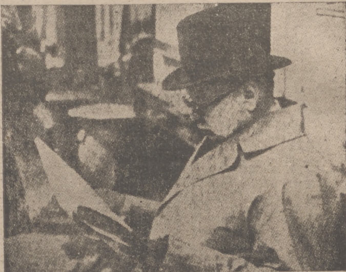
Ni cigarro puro ni sonrisa. En una estación de Londres, mister Churchill, envejecido y preocupado, lee un periódico mientras espera el tren para una rápida visita a las fortificaciones de la costa este de Escocia

Londres, 9. — En el banquete anual del Ayuntamiento de Londres el primer ministro, Churchill, ha pronunciado un discurso en el que declaró, entre otras cosas: «A pesar de todos los golpes que hemos sufrido, de todo el peso que llevamos sobre nues-