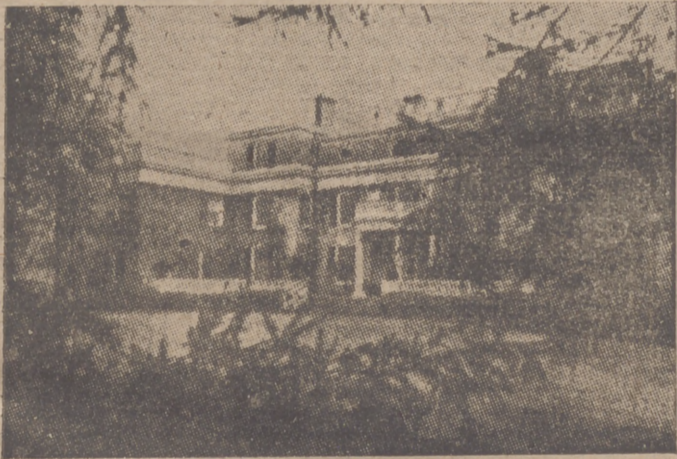
Hyde Park es la residencia particular del presidente Roosevelt. Se trata de una finca confortable, pero excesivamente cargada de objetos de arte y cuadros de escaso valor. En Hyde Park "no se debe abrir ninguna puerta totalmente, porque siempre hay un elemento decorativo que podría caerse y romperse".

Roma, 9.—Según las informaciones de los periódicos italianos el número de víctimas causadas por los bombardeos aéreos británicos sobre Turin y Moncaliera se elevan a diez muertos y bastantes heridos. Entre los muertos figuran dos ancianos, un niño de seis años y tres mujeres.—Efe.