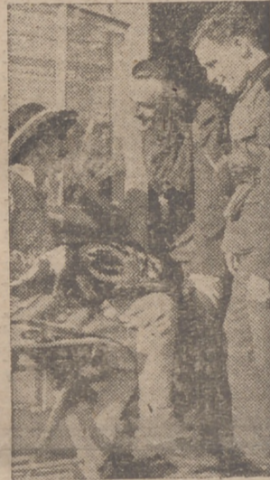
Zakopane.—Baile para los soldados alemanes.—Los soldados heridos que pasan su convalecencia en esta hermosa región, admiran los artísticos trabajos de los campesinos de esta comarca.

zado para llevar al país a una realidad económica que sea la de la prosperidad. No dejaremos hasta lograrlo. No es este un Sindicato más; puedo decir que es el más importante de todos los naciona-