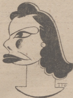
PILAR BIENER, actriz de la compañía que actúa en López de Vega. (Caricatura por ITO)