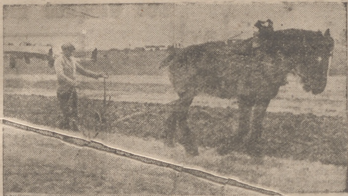
Protegido por el arma aérea alemana prosigue el campesino francés sus faenas del campo.