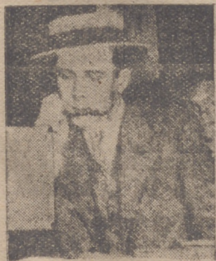
Willkie, que disputará a Roosevelt la Presidencia de los Estados Unidos. Willkie es un bibliómano y posee una de las mejores bibliotecas particulares de Norteamérica.

Londres, 8.—El Comité norteamericano de Londres, encargado de la evacuación de niños ingleses a los Estados Unidos, ha anunciado hoy que la evacuación a los Estados Unidos de dichos niños será suspendida durante todo el invierno.—Efe.