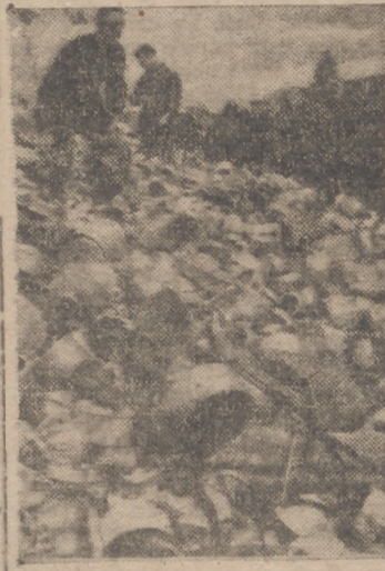
Los ingleses han dado sus cazuelas de aluminio para las fábricas de guerra. ¿Será que ya no las necesitan?