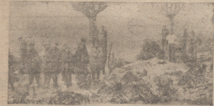
Restos de un aparato inglés derribado cuando intentaba bombardear Turin

Se interpreta como una manifestación de solidaridad hacia Gran Bretaña el hecho de que los Estados Unidos asuman la "lo di Roma"—que Londres apacigua esta actitud de los Estados Unidos demuestra que no tiene confianza en la fuerza de resistencia de la Gran Bretaña." Efe.