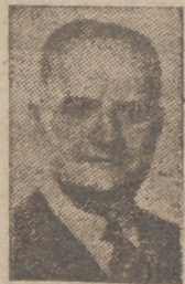
FIGURA DE ACTUALIDAD

La producción en las industrias de armamentos de la región londinense ha disminuido sensiblemente en la última semana, en que el Gobierno británico se ocupa especialmente de las repercusiones que en este aspecto pueden tener los vuelos alemanes.—Efe.