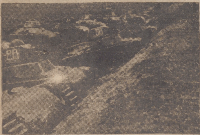
Los tanques en acción

Añade la declaración que, a causa de ciertas dificultades, la reunión de la Cámara y el Senado no podrá tener lugar antes de una semana.—Efe.