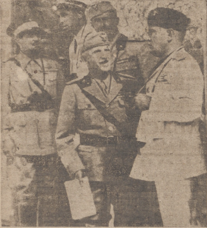
UNA FOTOGRAFIA HISTORICA S. M. el Rey-Emperador de Italia, S. A. R. el Principe de Piemonte, el Duca, Italo Balbo y el Duque de Aosta, Virrey del Africa Oriental Italiana, en las últimas maniobras militares