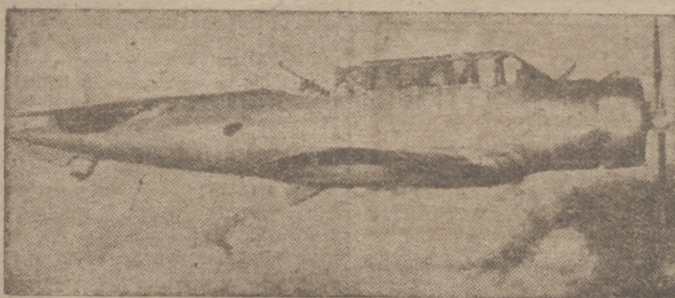
Un nuevo modelo de avión de asalto.

Roma, 20.—Según comunican de Berna a la agencia Stefani, los