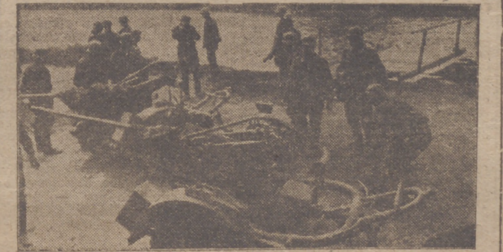
Una sección alemana de defensa aérea se prepara para cruzar un canal.

El comunicado dice textualmente: "El Gobierno francés, por mediación del Gobierno español, se ha dirigido hoy al Gobierno italiano en demanda de que sean entabladas negociaciones con Italia para un armisticio. El Gobierno italiano ha respondido por la misma vía y en la misma forma que el Gobierno del Reich, es decir: que ha hecho saber que esperaba se le indiquen los nombres plenipotenciarios franceses, con el fin de señalar día, lugar y fecha de la conferencia".—Efe.