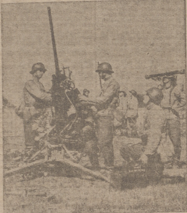
Los búlgaros hacen ejercicios de defensa antiáerea.