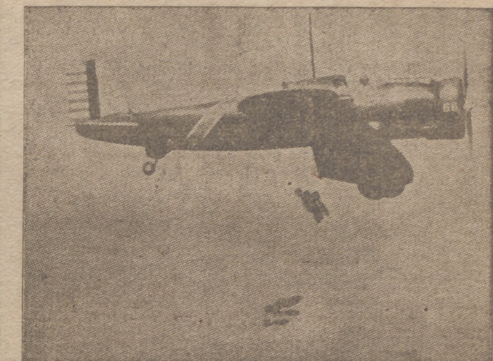
Un «Curtiss A-12», uno de los tipos de aviones de asalto del Ejército aéreo americano, en un momento de pruebas durante las pasadas maniobras

Pide el «Tokio Nichi Nichi» que cese inmediatamente esta actitud antijaponesa de la Indochina antes de que el Japón adopte nue-