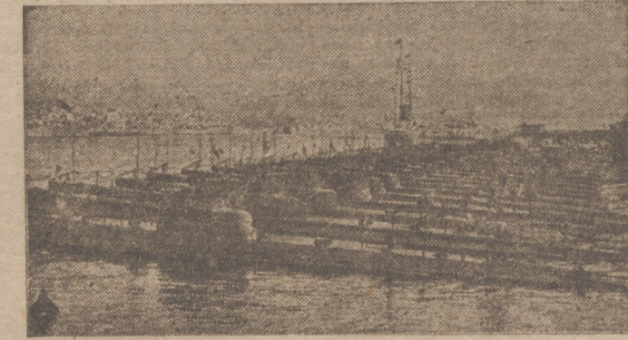
Un considerable grupo de submarinos amarrados en el puerto de Nápoles.

El Cairo, 16.—El Cuartel General británico comunica: "Varias unidades de las fuerzas aéreas y navales italianas atacaron ayer Sollum. Nuestras pérdidas fueron dos oficiales y 20 soldados del Cuerpo