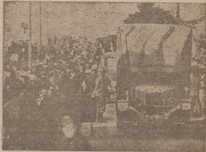
EL EXODO DE LA POBLACION CIVIL EN FRANCIA