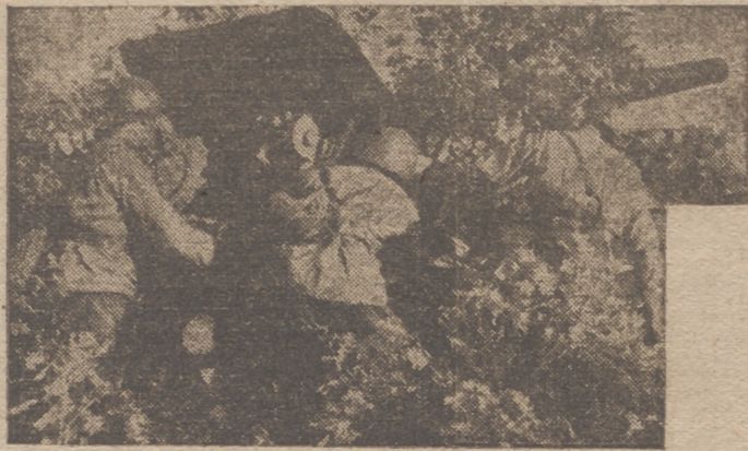
ARTILLERIA EN ACCION

Las pérdidas del enemigo en el aire fueron ayer ocho aviones: cinco derribados en combate y el resto