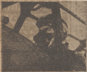
Un piloto dispuesto a remontarse a elevadas altitudes.

Cuartel General del Führer, 6 (4,15 tarde).—El mando supremo del ejército alemán comunica: "Las operaciones comenzadas ayer en Francia se desarrollan metódicamente. Nuestras tropas han ganado terreno en todas partes hacia el Sudoeste. El número de prisioneros cogidos cerca de Dunkerque ha aumentado a 59.000. El botín de armas y material de todas las categorías no ha podido aún ser clasificado.