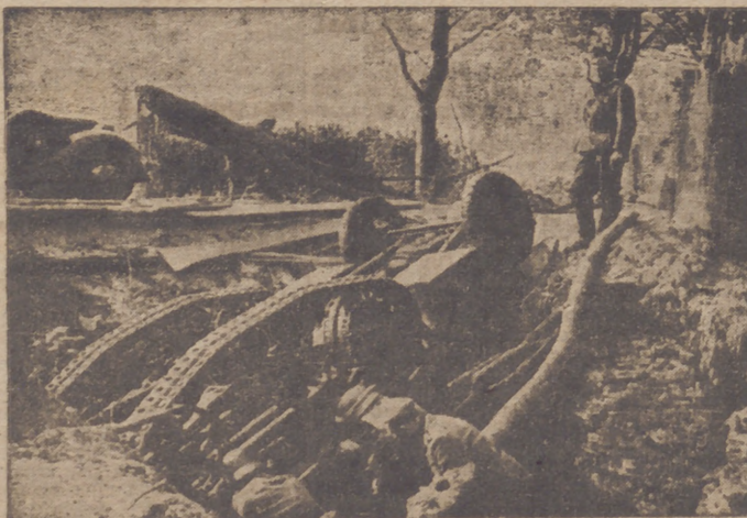
Tanque francés abandonado durante la retirada.

Casa central en Madrid: PLAZA DEL ANGEL, NUMERO 8