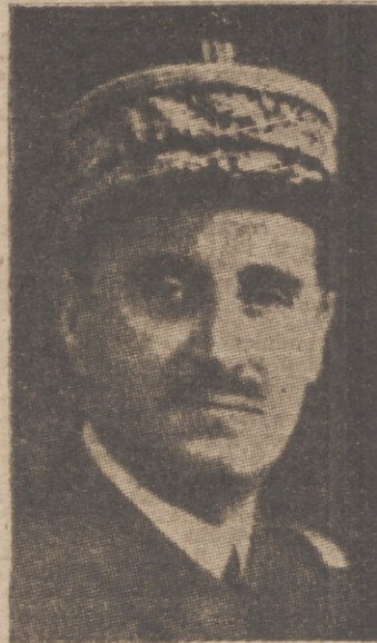
El general francés Blanchard

De entre todos aquellos que precisan la protección y ayuda de los españoles que se bastan a sí mismos, las mujeres madres, por la trascendental función que representan, y los niños, por su debilidad, son acreedores a un mayor y más inteligente cuidado. Por ello Auxilio Social proyectará su actividad hacia la creación de instituciones mediante las que, con una colaboración técnica que asegure el más perfecto cumplimiento de su elevada misión, se resuelvan los problemas de la maternidad y la infancia desvalidas, que hoy preocupan en alto grado a los rectores del Estado nacional-sindicalista.