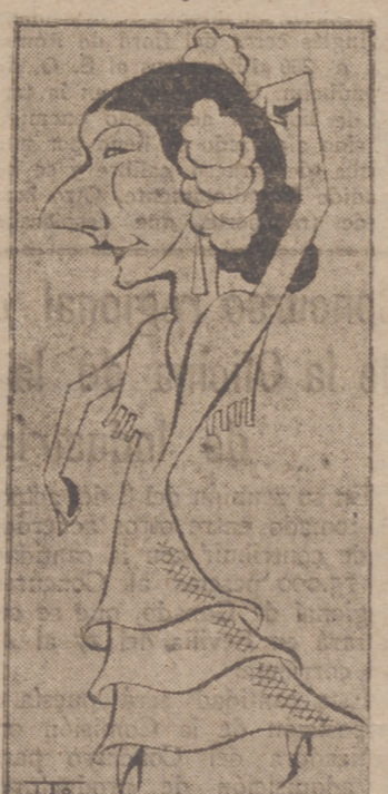
La excelente artista Conchita Piquer

El espectáculo que a la vista nos presenta Conchita Piquer, repleto de color y armonía en su total contectura, deja traslucir, de la forma al fondo, un empeño de elevar a su justo nivel el folklore andaluz, demasiado perdido por la desaparición de múltiples intérpretes. Aprovechándose de su graciosa fisonomía se prodiga sin medida y, lo que es más importante, sin honradés artísticas, llegando a cambiar su natural belleza en la mayoría de los casos, de tal forma, que ante este espectáculo resulta notablemente su casi desconocida valía. Conchita Piquer logra rodeándose de intérpretes auténticos que, apegados al prestigio del rito tradicional, avalan la pureza del arte y forman estampa de color real. Gitanos y gitanas, arrancados de la cantera y escuela del Sacro Monte, dan vida al motivo de sainete con la armonía de la música y del baile. Así en "Estampa siglo XVIII" (Café de Chinitas), y especialmente en "Café de Cádiz", donde todos los intérpretes se expresan con el ritmo y voz del baile, acompañados