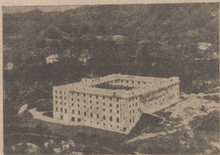
He aquí la Casa de Estudios de los Dominicos españoles de Filipinas, en Hong-Kong, donde se forman los futuros profesores de la española Universidad de Santo Tomás, una de las más completas del mundo

Fué fundada en 1611 por el Padre dominico Miguel de Benavides