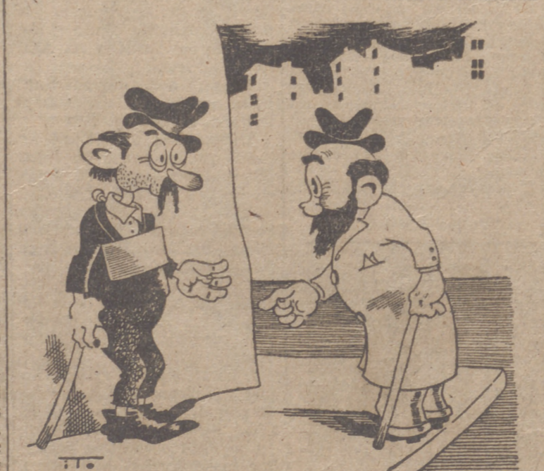
Demostración práctica Por ITO —De manera que usted escribió ese libro titulado "Las mil maneras de ganarse la vida" y ahora se ve pidiéndote —Si, señor. ¡Esta es una de las mil maneras!

países. Estas ofertas han permanecido sin respuesta hasta este momento, y esto no ha cambiado la actitud del Gobierno francés. Con este mismo espíritu se ha intentado en los últimos meses mejorar las relaciones con el Gobierno español. El Gobierno francés, aparte de toda consideración ideológica, continuará sus esfuerzos cerca de estos dos países para llegar a un acuerdo en el Mediterráneo, lo que constituye a sus ojos una base indispensable de paz. Reynaud ha celebrado la comunidad de ideales impera entre los Estados Unidos y Francia, y ha afirmado su fe en el triunfo de los pueblos libres. El presidente de la Comisión ha dado las gracias a Reynaud y ha testimoniado la adhesión del Senado en sus trabajos para la dirección de la guerra.—Efe.