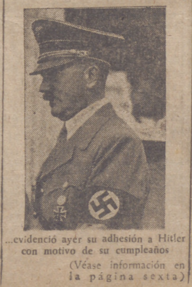
evidenció ayer su adhesión a Hitler con motivo de sus cumpleaños (Véase información en la página sexta) Efe.

"Levante" en honor del subsecretario de Prensa y periodistas que asisten a la concentración. Por la noche habrá una comida en homenaje a las personalidades.—Cifra.