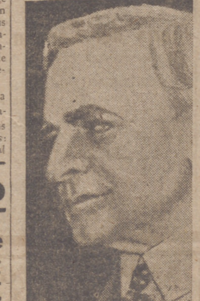
M. ARITA y M. CORDELL HULL, que han mantenido una entrevista muy importante sobre los intereses del Japón y de los Estados Unidos en el Océano Pacífico