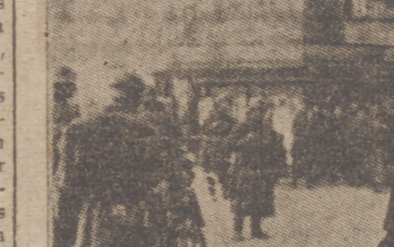
Entrada de las fuerzas armadas de Alemania en un pueblecito de Dinamarca