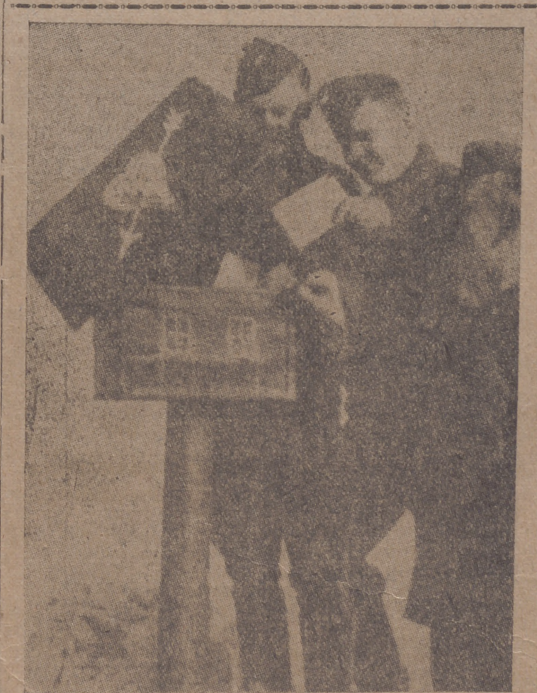
Un buzo en el frente.—Soldados alemanes echando en el sus car tas.

algunos barcos que se hallan inactivos y se dediquen a estos transportes.—Efe.