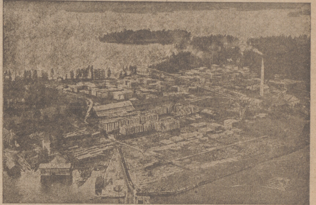
Como consecuencia de los grandes bosques Finlandia tiene numerosos aserraderos. He aquí uno de los contrastes delocados que, de hallarse en otro país, constituiría un atractivo para el turismo

Ciudad del Vaticano, 2.—Hoy se celebra en Roma el aniversario de la elección del Soberano Pontífice, quien, en este mismo día, cumple sesenta y tres años. Con este motivo la Ciudad del Vaticano está engalanada con banderas pontificias. No obstante, esta fecha se celebrará todavía con mayor solemnidad el 12 del corriente, aniversario de la coronación.—Efe.