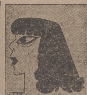
RAQUEL MELLER (Caricatura por ITO)

Raquel Meller y Carmelita Vázquez presiden como "estrellas" este conjunto, que pretende diferenciarse artísticamente de los ya conocidos solamente por el precio en taquilla. La tan conocida artista, aun poseyendo todavía cualidades estimables, será juzgada apartando de la crítica el sentimentalismo del recuerdo y atemperándola a la pretensión económica del espectáculo. Las características de exquisita finura en el modo de decir el cuplé son cualidades personales que conserva Raquel Meller y con las que podrá mantenerse en los escenarios con aplauso. El público que ayer