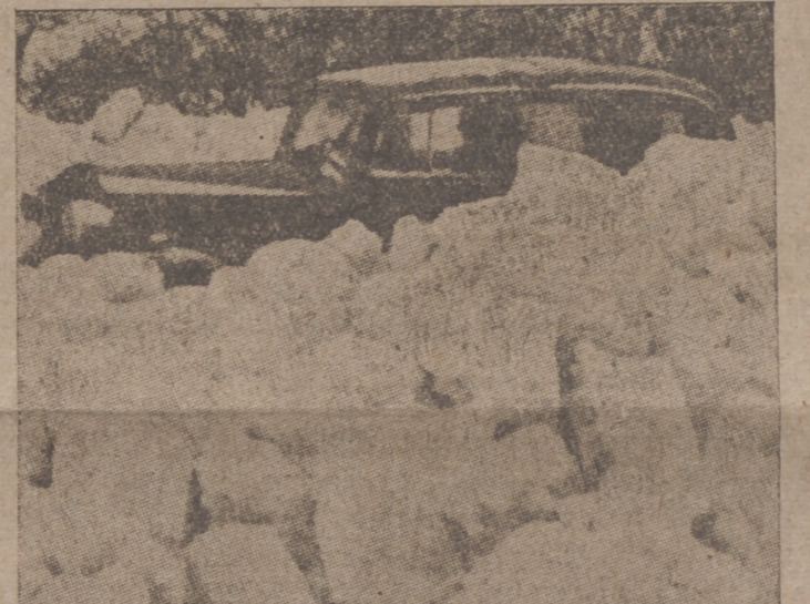
Un coche en situación difícil bloqueado por los hielos en una carretera obstruida