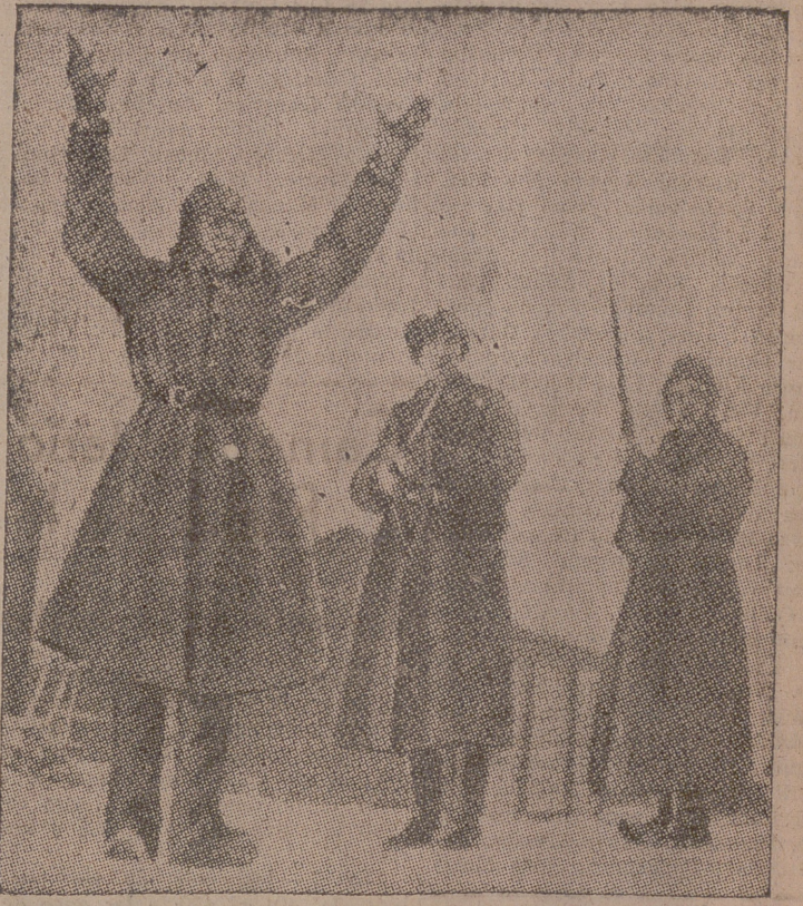
Un soldado ruso hecho prisionero por las tropas finlandesas