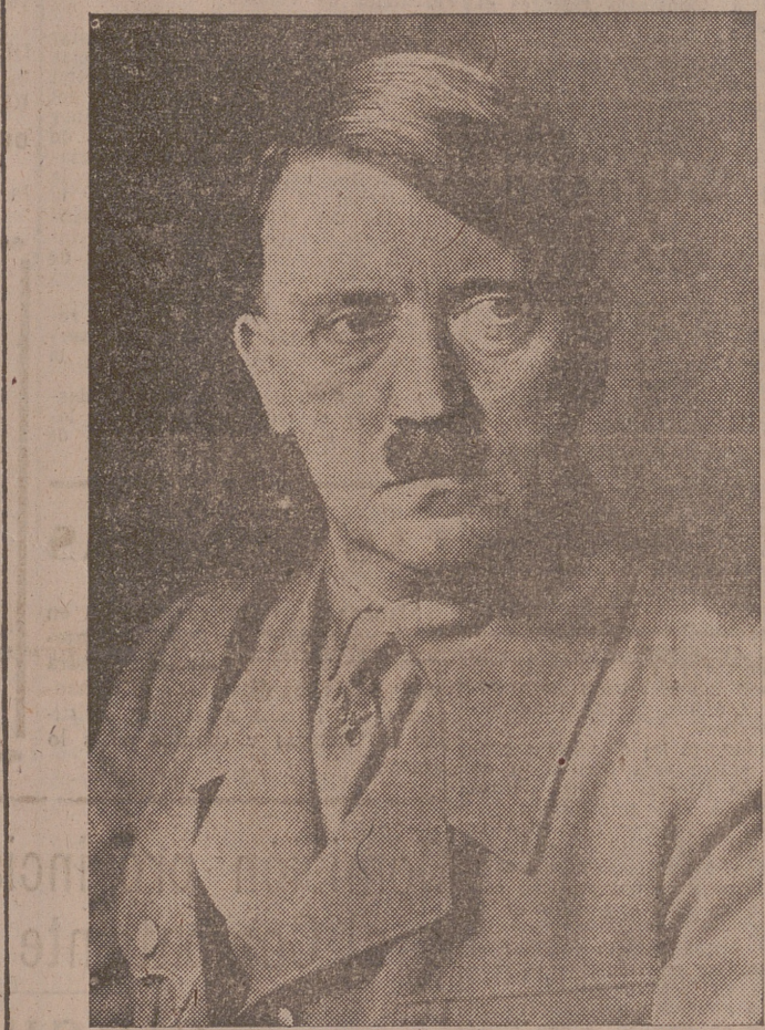
Berlín, 6.—El Führer ha pronun luego a las pérdidas sufridas por el Reich.

"Sólo en la última revisión del Pacto de Versalles hubo que derramar sangre"