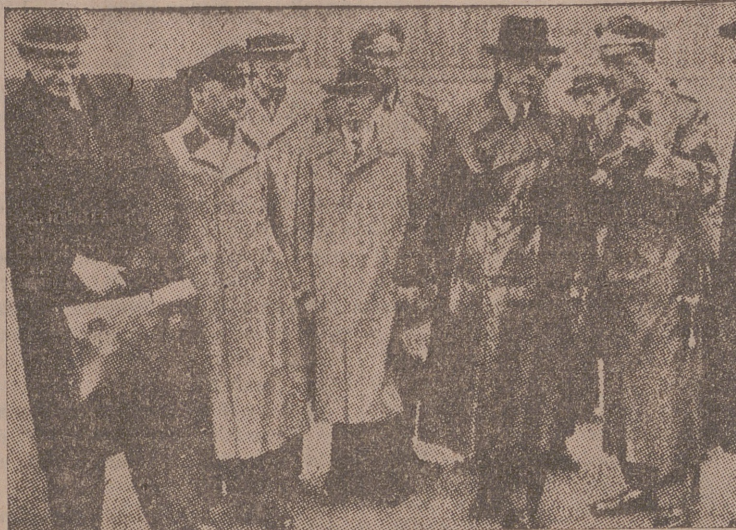
El ministro de Relaciones Exteriores del Reich, Von Ribbentrop, en el aeropuerto de Berlín, acompañado del embajador soviético en dicha capital, momentos antes de emprender su vuelo hacia Moscú

wa—que el Reich ha iniciado una amplia ofensiva de paz. ¿Corresponde esto a las intenciones del Gobierno del Reich?