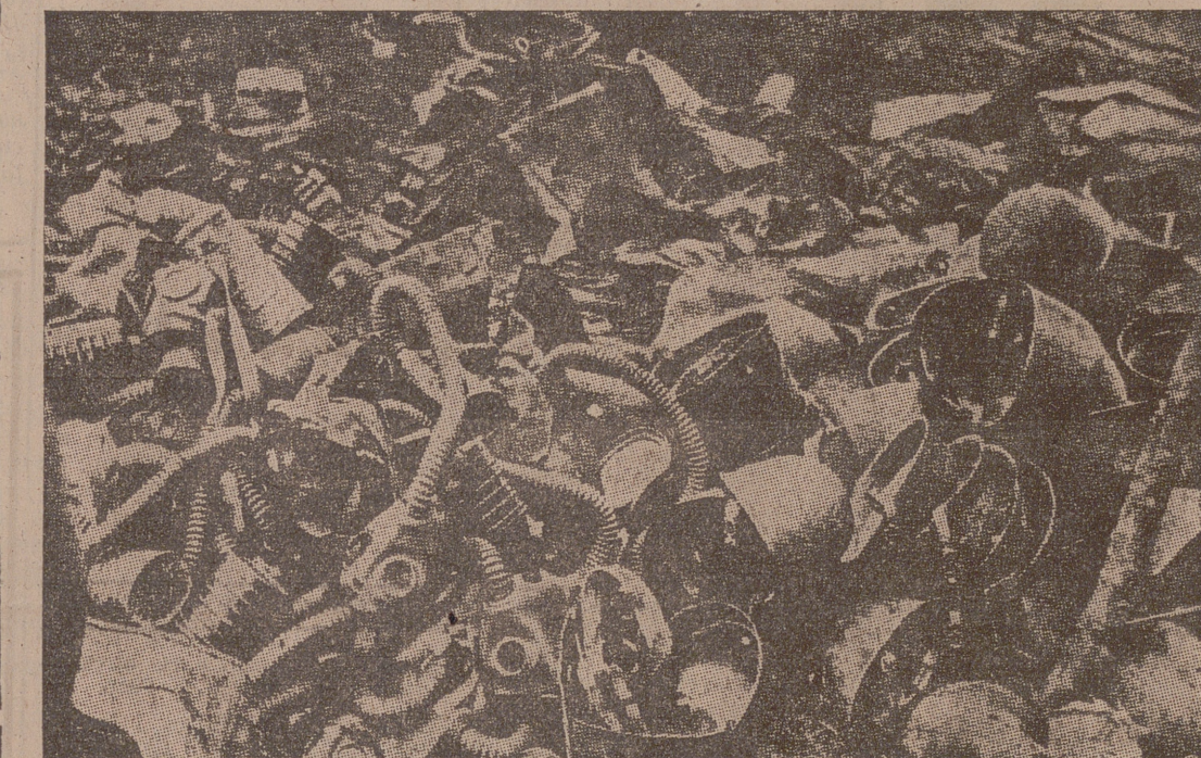
Partieron los soldados polacos cargados con sus casacas contra los gases. Se había anunciado que la guerra sería bárbara, inhumana. Al rendirse, en las trincheras polacas aparecieron a millares, en grandes montones con el resto del material abandonado

La petición de paz es sólo una primera derrota de los alemanes, y si la guerra se prolonga no será la última. ¿Por qué piden la paz? Porque ellos sienten llegar la fatal derrota, la catástrofe militar que predice a Hitler el general von Fritsch: en el Occidente no pueden contar con los éxitos de Oriente. Y el ejército rojo, después de los fusilamientos de Stálin, no es más que una horda sin cabeza.