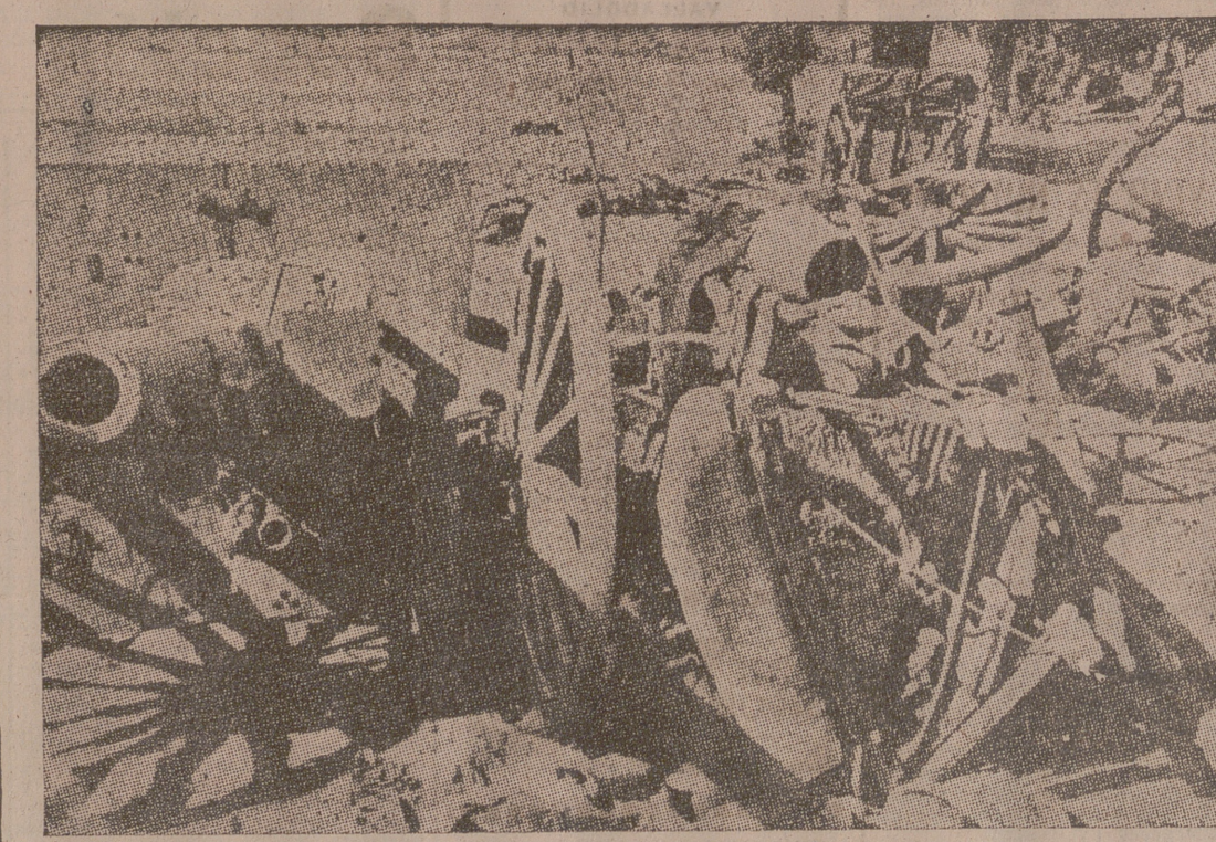
Restos de una columna de artillería polaca